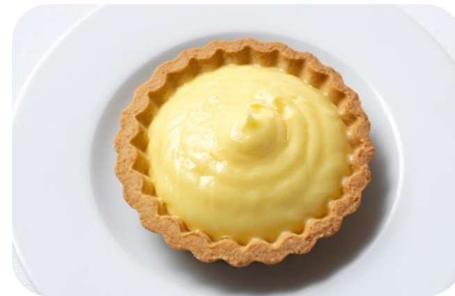
14 1655 Ispirazione alla Crema Mürbeteig-Tartlet mit Vanille-Pâtisseriescreme zum Verfeinern

🍷 95 g/St. 📦 20 St./Kt. ❄️ ca. 1-2 Std. 🍴 servierfertig