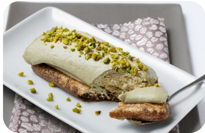
14 1656 Mono Tiramisù Pistacchio Kaffeedessert mit Pistaziencreme Löffelbiskuit | Kaffee | Pistaziencreme | gehackte Pistazien

🍷 120 g/St. 📦 10 St./Kt. ❄️ ca. 1-2 Std. 🍴 servierfertig