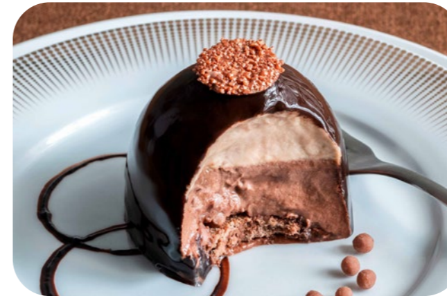
14 1523 Venere Nera Haselnuss-Schokoladen-Dessert mit glänzender Kakaoglasur und Dekor Haselnuss- und Schokoladencreme | Kakaobiskuit | glänzende Kakaoglasur | Dekoration aus weißer Schokolade in Gold beiliegend

🍷 90 g/St. 📦 6 St./Kt. ❄️ ca. 1-2 Std. 🍴 servierfertig