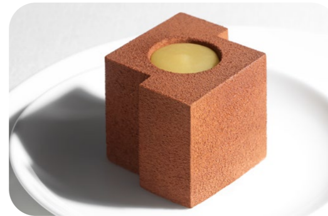
14 1164 Geometria di cioccolato e pere Schokoladen-Birnen-Dessert Schokoladencreme | Birnenpüree | Birnenwürfel | Kakao

🍷 90 g/St. 📦 6 St./Kt. ❄️ ca. 1-2 Std. 🍴 servierfertig