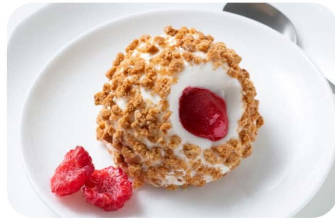
04 1641 Tartufo Cheesecake Cheesecake-Eistrüffel mit Himbeer-Erdbeer-Kern und Butterstreuseln Käsekuchen-Eis | Erdbeer- und Himbeersauce | Butterstreusel

🍷 120 g/St. 📦 10 St./Kt. ❄️ ca. 1-2 Std. 🍴 servierfertig