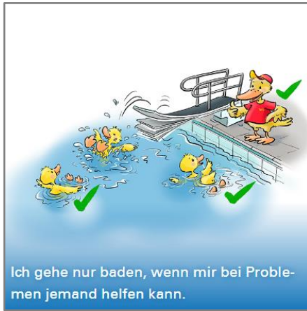
Ich gehe nur baden, wenn mir bei Problemen jemand helfen kann.