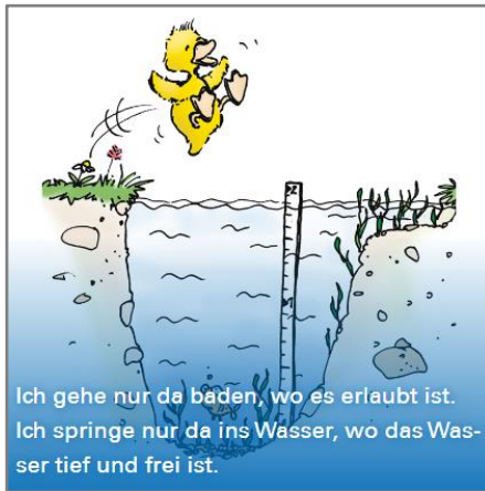
Ich gehe nur da baden, wo es erlaubt ist. Ich springe nur da ins Wasser, wo das Wasser tief und frei ist.