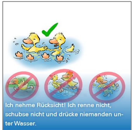
Ich nehme Rücksicht! Ich renne nicht, schubse nicht und drücke niemanden unter Wasser.