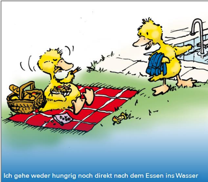
Ich gehe weder hungrig noch direkt nach dem Essen ins Wasser