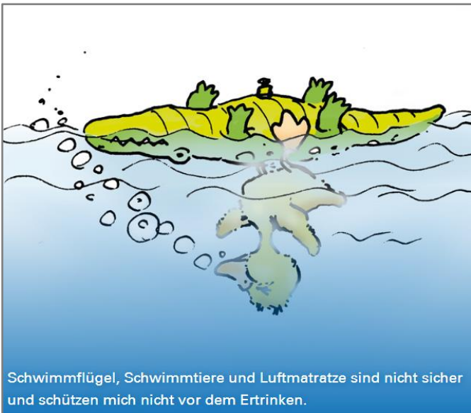
Schwimmflügel, Schwimmtiere und Luftmatratze sind nicht sicher und schützen mich nicht vor dem Ertrinken.