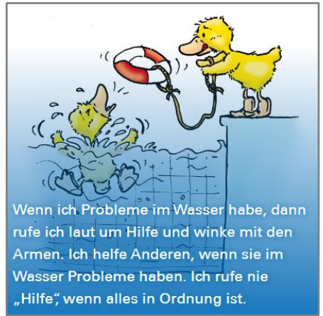
Wenn ich Probleme im Wasser habe, dann rufe ich laut um Hilfe und winke mit den Armen. Ich helfe Anderen, wenn sie im Wasser Probleme haben. Ich rufe nie „Hilfe“, wenn alles in Ordnung ist.