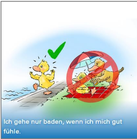
Ich gehe nur baden, wenn ich mich gut fühle.