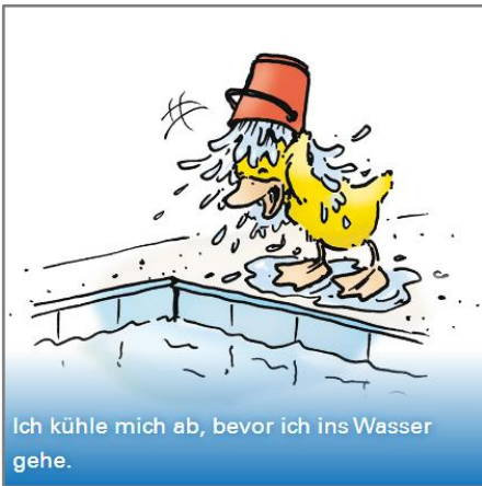
Ich kühle mich ab, bevor ich ins Wasser gehe.