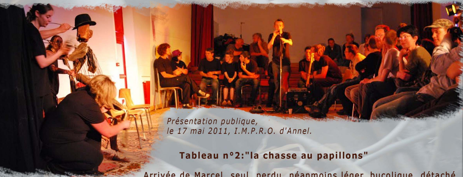
Présentation publique, le 17 mai 2011, I.M.P.R.O. d'Annel.

7 ème et dernière séance (journée entière): RÉPÉTITION GÉNÉRALE ET "PRÉSENTATION PUBLIQUE"