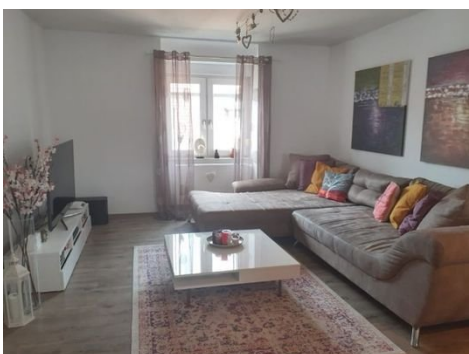
2. OG Wohnen