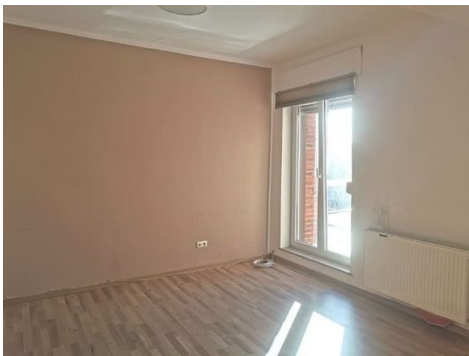
1. OG Zimmer 3