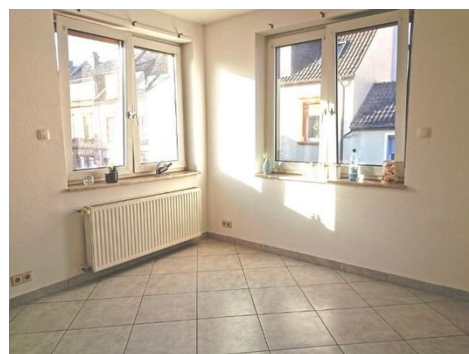
1. OG Küche