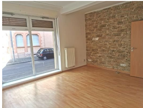
EG Wohnen Bild 1