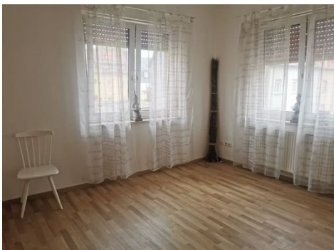
1. OG Zimmer 1