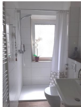
2. OG Bad 1