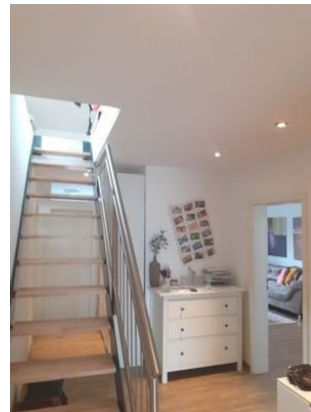
2. OG Diele