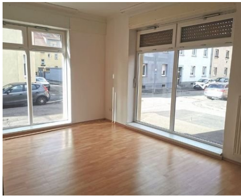
EG Wohnen Bild 2