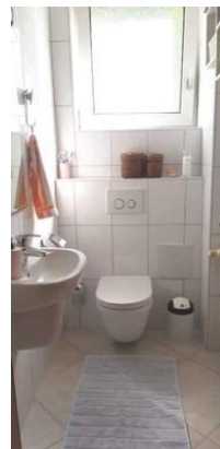
EG Gäste WC