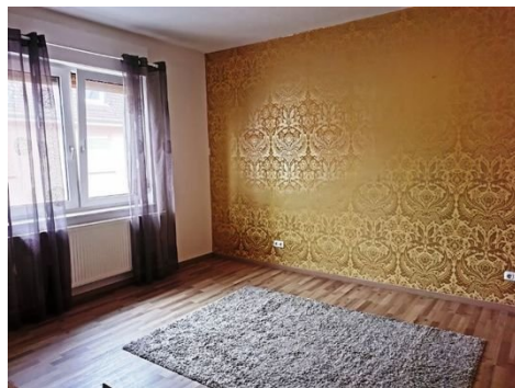
1. OG Wohnen