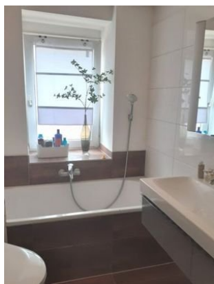
2. OG Bad 2