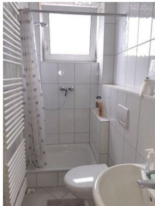
1. OG Tageslichtbad 2