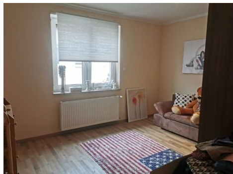
1. OG Zimmer 2