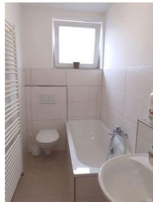
1. OG Tageslichtbad 1