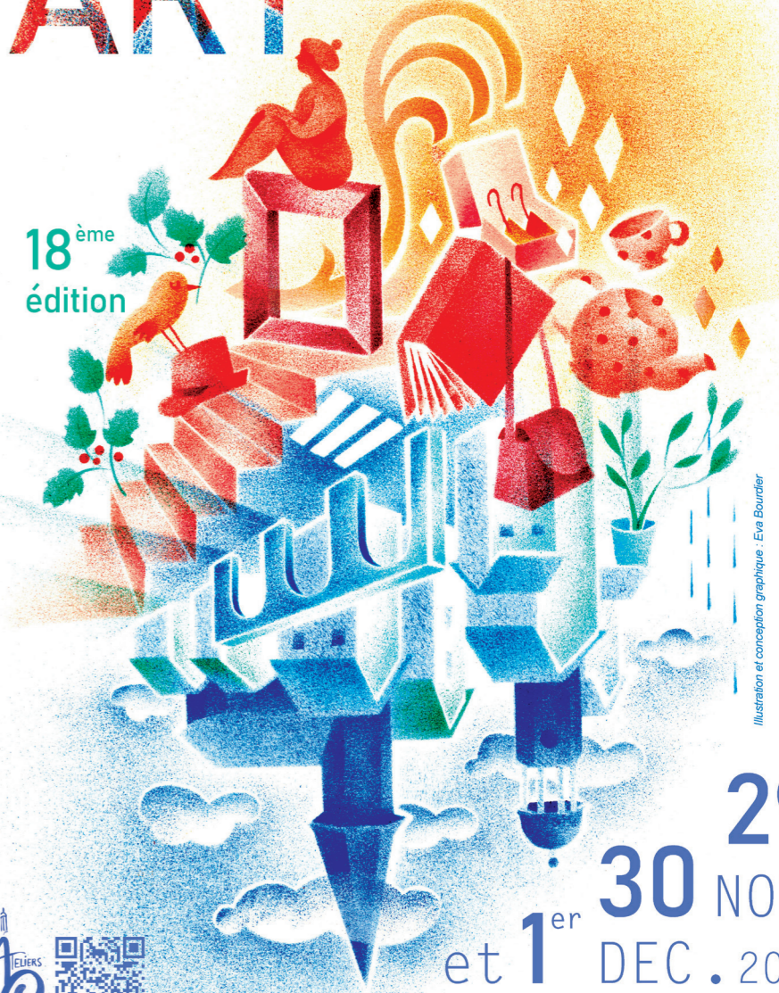
Illustration et conception graphique : Eva Bourdier