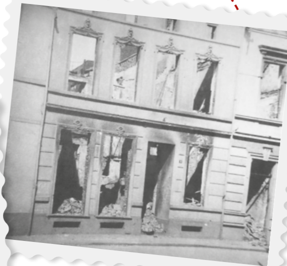
Nach dem Bombenangriff von 1943 steht nur noch die Fassade des alten Gebäudes.