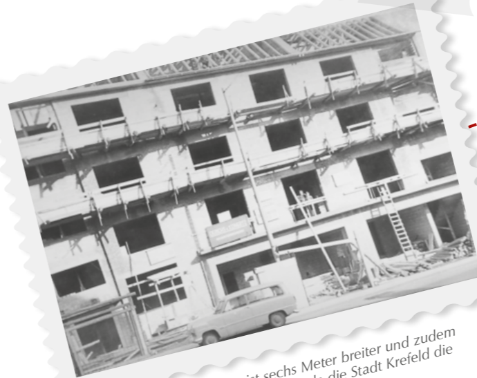
Der Neubau ist sechs Meter breiter und zudem nach hinten versetzt, da die Stadt Krefeld die Straße verbreitert hat.