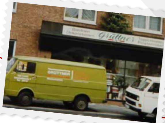
Das Geschäft Anfang der 80er Jahre mit neuer Werbung an der Fassade.