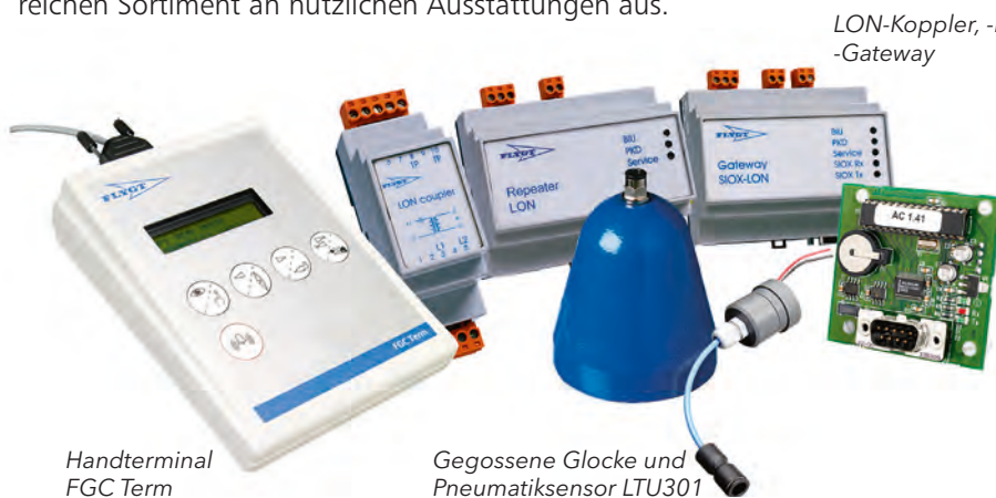
LON-Koppler, -Repeater und -Gateway

Niemand kennt Ihre Stationen besser als Sie. Suchen Sie Ihr Wunschzubehör aus unserem umfangreichen Sortiment an nützlichen Ausstattungen aus.