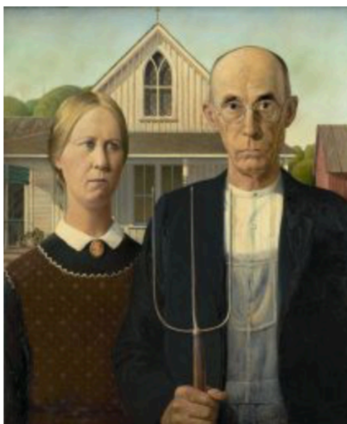
American Gothic , tableau de Grant Wood, version originale, 1930