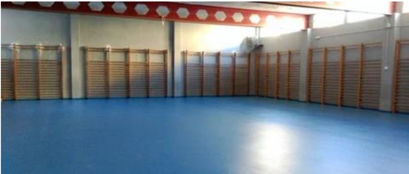
Sistema epoxi en base agua de bajo espesor