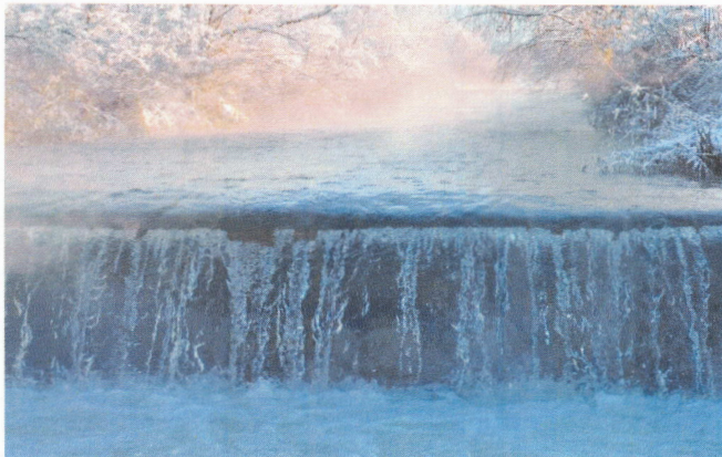
Gürbe Dezember 2023