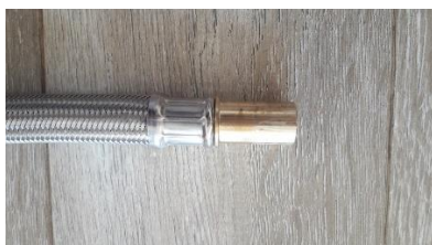
H) 22 mm brass tube end