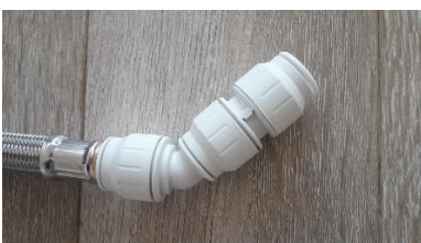
E) 22 mm push-in / 45° angle