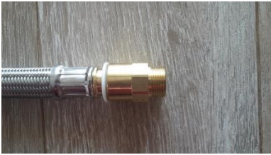
A) 3/4" BSP brass metal

Für den Anschluss der flexiblen Schläuche an die Hauptwasserleitung stehen uns mehrere Möglichkeiten zur Verfügung, um eine passende Lösung zu finden, wenn Ihre spezifische Situation es erfordert: