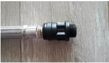
B) 3/4" BSP PVC