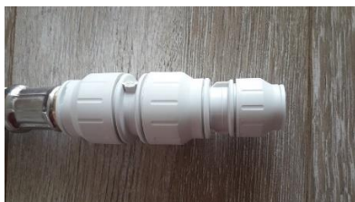
G) 22 > 15 mm push-in reduce collar