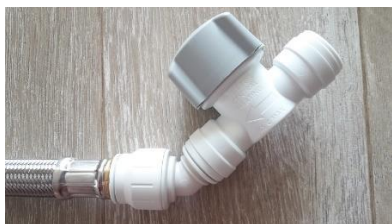
F) 22 mm water stop push-in / 45° angle