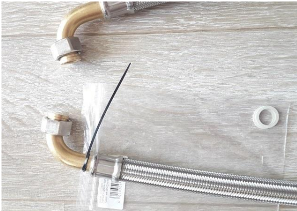
NL - Aansluiting op filterhuis