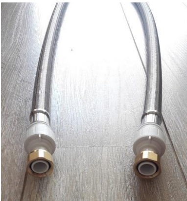
C) 3/4" BSP brass metal