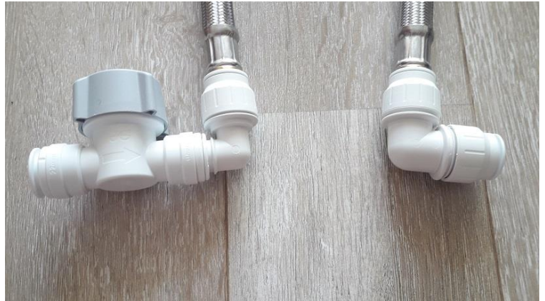
NL - Aansluiting op hoofdwatleiding