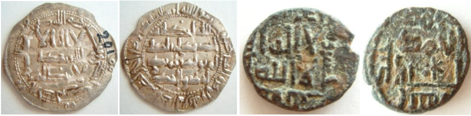
AÑO 201 H. 24898 ref.201.5 25320