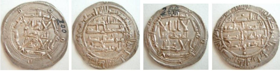
AÑO 200 H