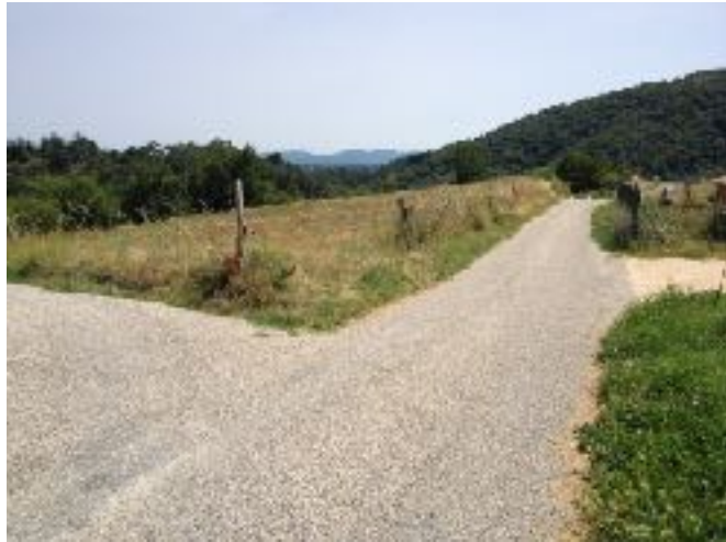
Le chemin du Pré La Viole