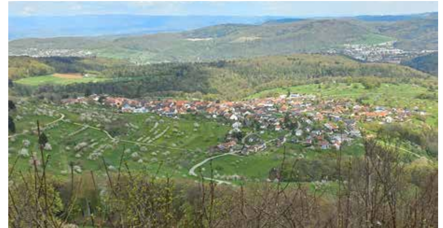
Herrenfluh mit Blick auf Nuglar

Kaum begonnen haben wir Ende Oktober unser Wanderjahr 2023 schon wieder abgeschlossen. Mir scheint, die Zeit geht immer schneller vorbei, je älter wir werden. Man muss aufpassen, dass wir das Erlebte nicht nur abspulen, sondern auch geniessen können. Bei recht guten Verhältnissen konnten wir mit Ausnahme der Oktoberwanderung alles nach Programm ablaufen.