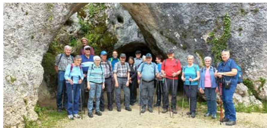
Wir sind auf gutem Weg