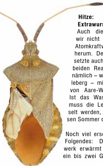
Eine Wanze mit verkrüppeltem Flügel aus dem Umfeld eines Schweizer Atomkraftwerks. Kein Grund zur Beunruhigung?! (c) Cornelia Hesse-Honegger.

Im Anschluss hielt Cornelia Hesse-Honegger einen Vortrag über «Die Macht der schwachen Strahlung». Die naturwissenschaftliche Zeichnerin dokumentierte die Folgen der Super-Gaus von Tschernobyl und Fukushima für Insekten vor Ort, aber auch in weit entfernten Gebieten, wo es durch Regen zu radioaktivem Fallout kam, z.B. in der Südschweiz. Die Zeichnungen der durch Mutationen missgebildeten Tierchen waren belegend. Noch beunruhigender ist aber, dass solche Mutationen auch im Umfeld von «normal» laufenden Atomkraftwerken vorkommen. Umso dringlicher erscheint es deshalb, diesem Unfug ein für alle Mal ein Ende zu bereiten.