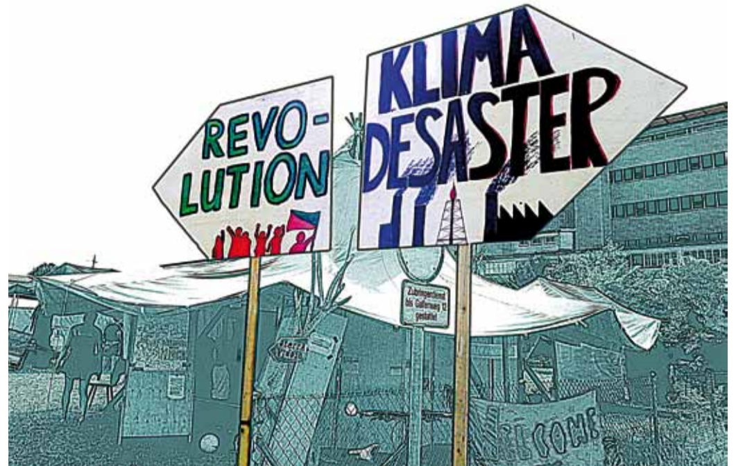
Revolution oder Klima-Desaster - laut Klimacamp zwei alternativlose Alternativen.

https://www.climategames.ch/klimacamp https://youtu.be/d4ZyYBoR2TQ