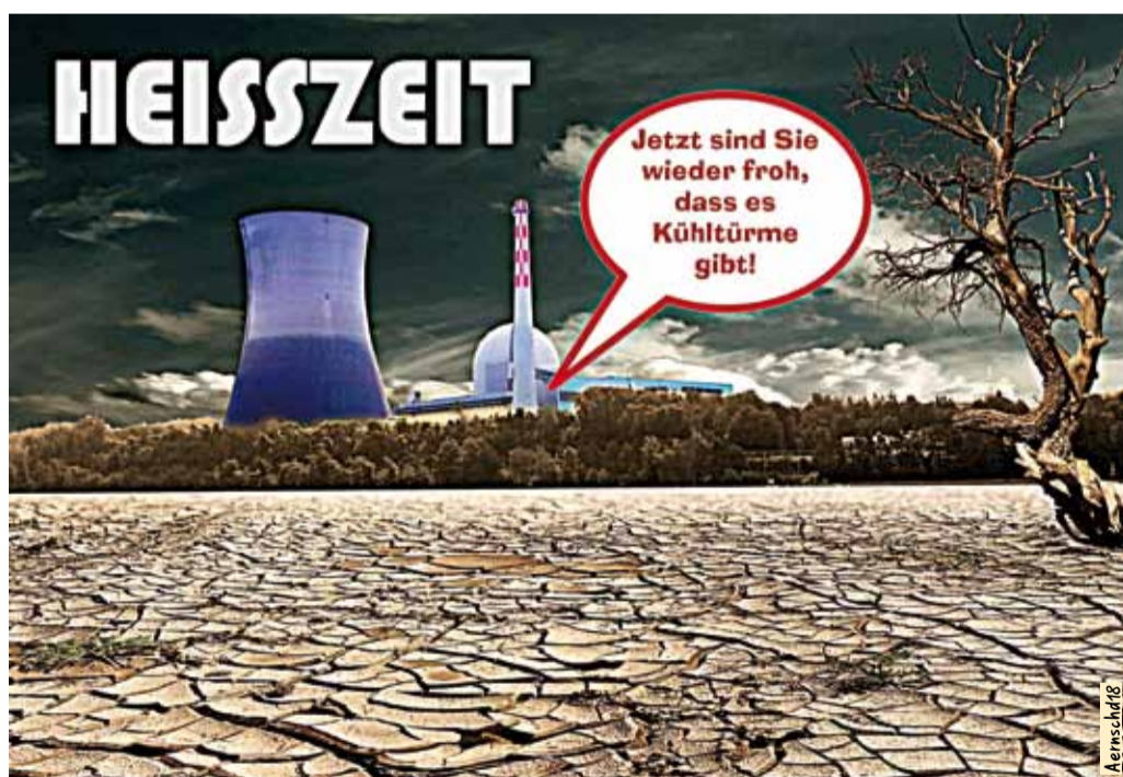
Cartoon Aernschd Born