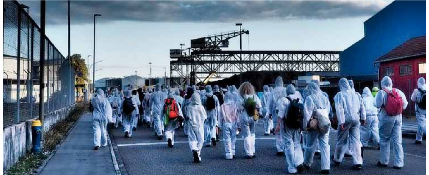
Vom 3. bis 13. August 2018 fand in Pratteln bei Basel das Klimacamp statt, tatkräftig unterstützt von NWA. An den Aktionstagen 10. und 11. August wurde in gewaltfreien Aktionen unter anderem der Basler Ölhafen blockiert, um auf die Rolle des Öls angesichts der drohenden Umweltkatastrophe hinzuweisen.