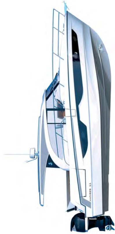
Profil - Version « coupé »