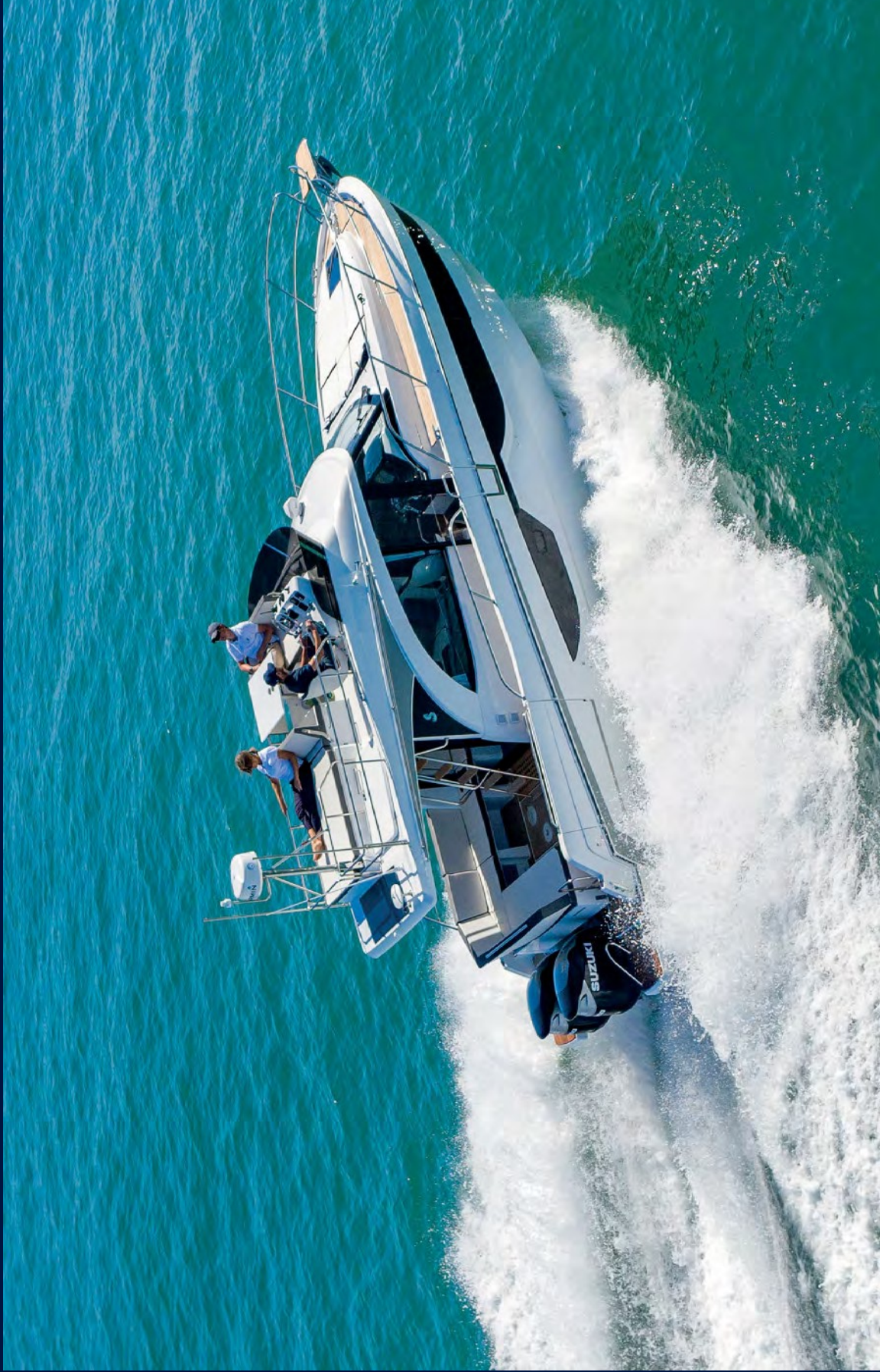
With a flybridge blending seamlessly into the profile of the Antares 11 FLY, the boat offers even greater comfort on board and the thrills of outdoor boating. Avec le flybridge parfaitement intégré, l'Antares 11 FLY permet de profiter pleinement des plaisirs de la navigation en extérieur.