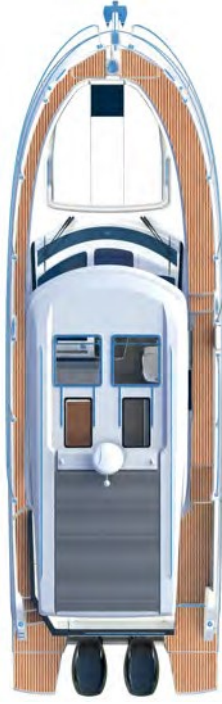
Vue du dessus