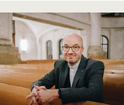
Landesbischof Tobias Bilz