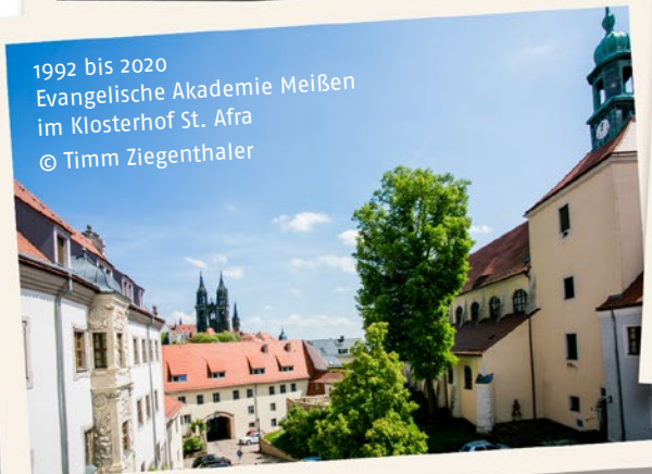
1992 bis 2020 Evangelische Akademie Meißen im Klosterhof St. Afra