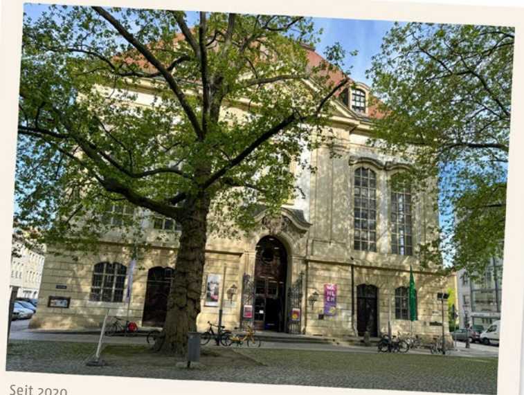
Seit 2020 Evangelische Akademie Sachsen in der Dreikönigskirche in Dresden