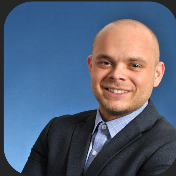
Alexander Schindler Projekte & Bau