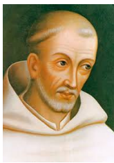
Bernard de Clairvaux (1090-1153)

Né dans une famille noble de Bourgogne, il entre en 1112 comme moine à l'abbaye de Cîteaux puis fonde, l'année suivante une nouvelle abbaye à Clairvaux. Il conseille le pape et les rois. En 1146, il prêche pour la deuxième croisade en présence du roi Louis VII. Il est canonisé en 1174 par le pape.