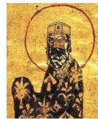
Alexis I er Comnène (1058-1118)

Officier kurde, il conquiert l'Égypte en 1171, renversant la dynastie des Fatimides. Il fonde sa propre dynastie sur un État musulman unifiant l'Égypte et la Syrie. Menant le djihad contre les chrétiens en Orient, il reprend Jérusalem en 1187 pendant la troisième croisade dirigée contre lui.