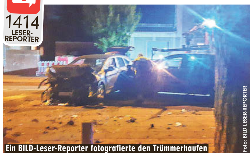
Ein BILD-Leser-Reporter fotografierte den Trümmerhaufen