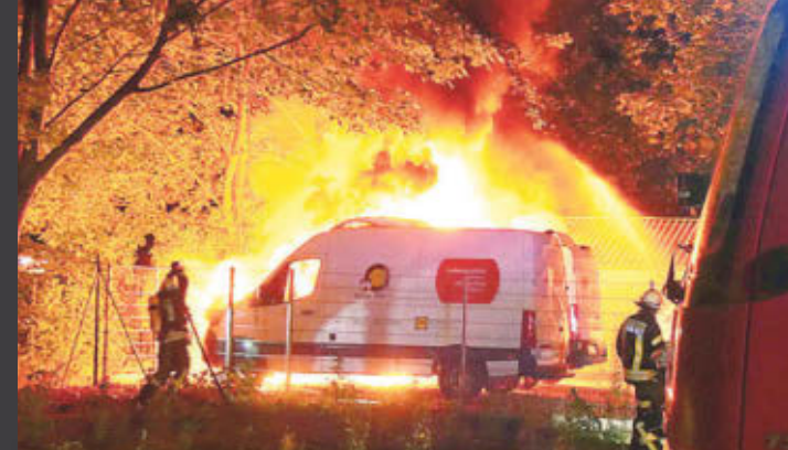
Das Feuer griff von einem Transporter auf zwei andere über. Ein vierter wurde beschädigt