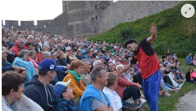
Un spectacle avec de belles interactions avec le public fougérois | OUEST-FRANCE

Pour cette nouvelle séance des Jeudis du château, à Fougères (Ille-et-Vilaine) , la Cie Pérégrin, a présenté son spectacle Air de jeux , mis en scène par Lucie Calvet. Une nouvelle fois, la thématique est en lien avec les Jeux olympiques 2024. Les artistes ont choisi de travailler sur l'envers du décor de la vie des athlètes de haut niveau : leurs émotions au fil de leur carrière. Ils se sentent particulièrement connectés à l'univers de ces professionnels, car la vie des artistes est très similaire.