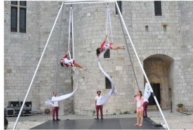
Les six artistes ont évolué au sol et dans les airs.

C'est dans la cour du château de Sully-sur-Loire que la compagnie Pérégrin a présenté son nouveau spectacle Airs de jeux jeudi soir. Cette prestation s'est effectuée sur une chorégraphie de Lucie Calvet, devant un public conquis et enthousiaste.