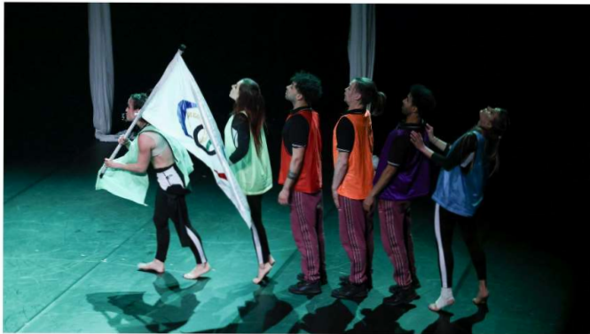
Un avant-goût des Jeux olympiques célébrés ce mercredi.

A cent jours de la cérémonie d'ouverture des Jeux de Paris, les valeurs de l'olympisme ont été transmises à travers un spectacle joué à l'abbaye de Neumünster.