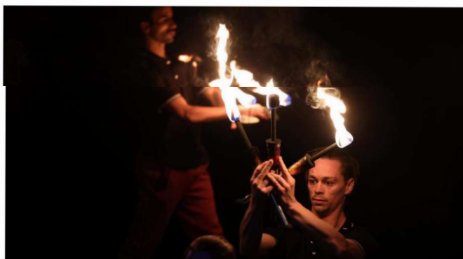
Le show a débuté par la cérémonie du feu.

Sans plan d'eau, il était difficile d'illustrer le surf, mais on pouvait deviner les vagues de Tahiti à travers les ondulations des corps. L'escalade, elle, était symbolisée par des tissus aériens sur lesquels Alice et Gillian, les deux autres filles, ont rivalisé de virtuosité. Ce fut sans doute la partie la plus spectaculaire d'un show débuté par la cérémonie du feu. Celle que nous venons de vivre à Olympie il y a quelques jours lorsque la flamme fut allumée. Un tableau revisité et tonifié par quelques jonglages qui rappelèrent combien les artistes sur scène maîtrisaient les arts circassiens.