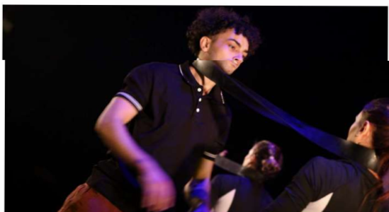
Spectacle Air de jeux-la flamme olympique au feu sacré.

La salle Robert Krieps a servi de décor à cette représentation jouée déjà plus de cinquante fois et qui espère pouvoir compter jusqu'à 100. «On a passé huit semaines en résidence pour roder ce spectacle. Je connaissais une partie des artistes. L'autre partie a été recrutée à partir d'auditions. L'intérieur comme l'extérieur peuvent se prêter au spectacle. L'objectif était d'aller à la rencontre de tous les publics avec un objet passe-partout.»