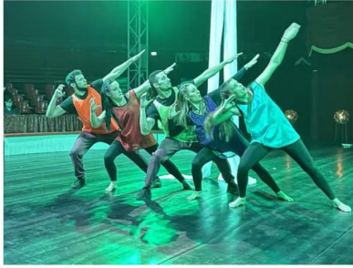
Quand le geste sportif rencontre le geste artistique.

Les artistes de la Compagnie Pérégrin' ont présenté leur nouveau spectacle, « Air de jeux », sous le chapiteau du cirque Gruss.