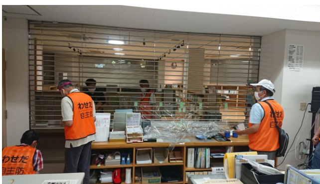
事務室の閉鎖方法の確認