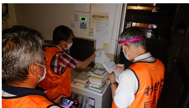
セキュリティ解除・照明点灯方法の確認