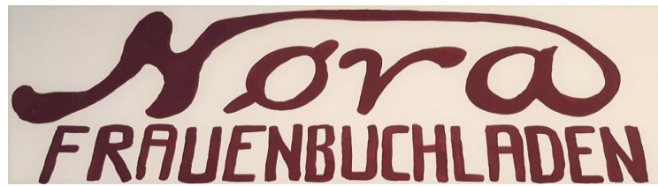
Schriftzug in der Bornheimer Straße