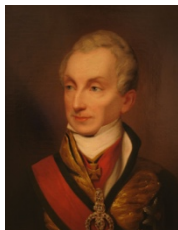
Klemens von Metternich (1773-1859)

Issu de la noblesse allemande, il fait ses études à Strasbourg mais s'oppose à la Révolution puis est contraint de fuir à Vienne. Ambassadeur à Berlin en 1803 puis à Paris en 1806, il devient le Ministre des affaires étrangères autrichien en 1809 et organise le congrès de Vienne à ce titre. Il est nommé Chancelier en 1821 et exerce le pouvoir jusqu'en 1848 où il est chassé du pouvoir lors de la révolte des Viennois.