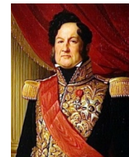
Louis Philippe I er (1773-1850)

Révolutionnaire, patriote et fervent républicain et partisan de l'unité italienne, il combat toute sa vie pour la concrétisation de l'unité italienne et pour l'instauration d'une république. Membre d'une société secrète (les Carbonari) à partir de 1827, il entre dans la clandestinité et la lutte politique. Chef du mouvement « Jeune Italie », il est contraint de s'exiler en France en 1831.