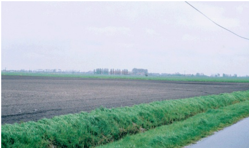
In de Moères, net als in andere sectoren van Maritiem Vlaanderen, is de hoogte soms lager dan zeeniveau.