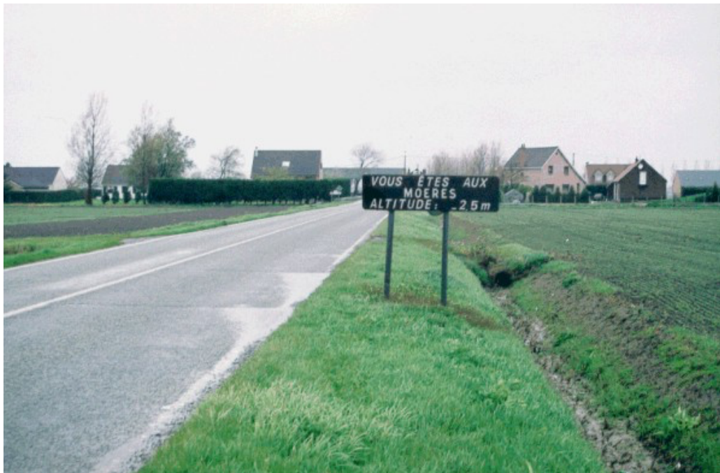
Maritiem Vlaanderen, een ander landschap dan Binnen-Vlaanderen.

Het is inderdaad een nieuw land, onlangs teruggewonnen op de zee en bevolkt door de mens. Dit uiteraard op de schaal van de geschiedenis van ons oude continent. Het platteland van Maritiem Vlaanderen behoudt nog enigszins de uitstraling van een nieuw land. Grote en compacte boerderijen (vergeleken met de rest van Vlaanderen) gelegen in het midden van hun landerijen, aan het einde van een recht steegje, overzichtelijke dorpen. Alles is rechtlijniiger dan in de rest van Vlaanderen, waar de regel eerder de bocht en de omweg is. Het vlakke landschap, de watergangen die richting zee lopen, de afwezigheid of bijna geen bomen verraden de recente verovering op de zee. De Moëres (een naam die ook moerassen betekent) zijn daar het meest perfecte voorbeeld van, wel uitzonderlijk sinds ze op zee zijn veroverd, veel later dan de rest van het gebied. We gaan in op de geschiedenis.