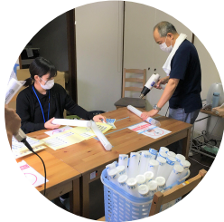
サッセン刀作成作業