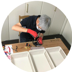
精密機械解体作業

作業内容は豊富な内職をメインに行っておりますが、他にも精密機械解体作業やサッセン刀製作、施設外作業も行っております！