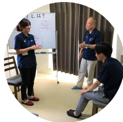
SST(Social Skills Training)