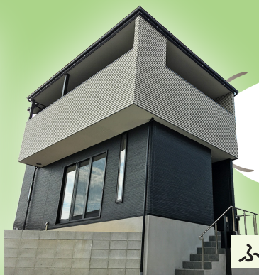
ふたばリフレッシュスペース

翌年10月には新築の リフレッシュスペースもOPEN 1階のカフェスペースでは 一杯100円でコーヒーも飲めます