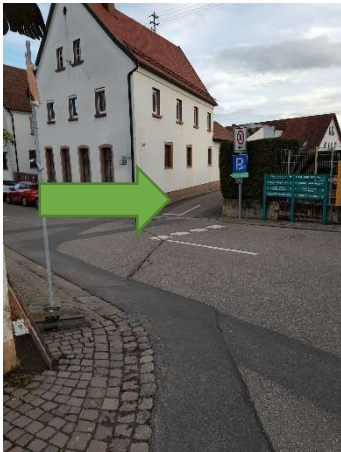
Foto: Rechtsschwenk auf die Weinstraße

Bei der nächsten Kreuzung verlassen wir die Weinstraße, die hier nach rechts abknickt und biegen für ein kurzes Stück in die Landauer Straße. Bald darauf setzen wir unseren Weg (leicht links versetzt) geradeaus auf der Gartenstraße fort.