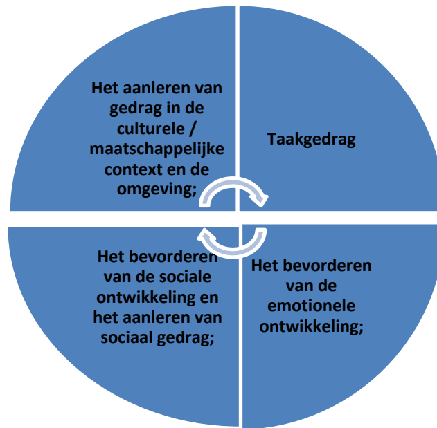
Figuur 1: Vier thema's in de basisondersteuning gedrag

Bovenstaande vier thema's vormen de inhoud van de Basisondersteuning Gedrag. Als deze vier thema's aangeboden worden door de leerkracht in de klas, kunnen we ervan uitgaan dat er sprake is van een evenwichtig aanbod voor de gedragsontwikkeling van alle leerlingen.