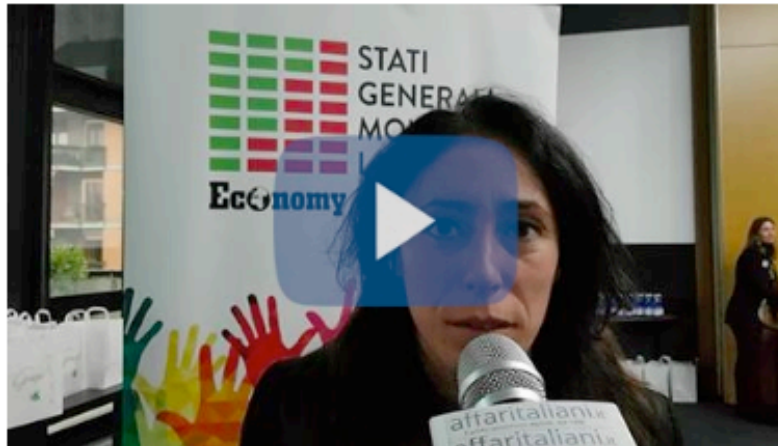
Vecchioni, Diversity: "Inclusione per creare qualcosa di nuovo"