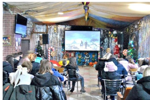
Kindgerechter Trickfilm über die Geburt von Jesus Christus

Ein herzlicher Dank an alle Spender für unsere Aktionen und an alle Mitwirkenden überall! Bitte lassen Sie Kaleb-Dienste e.V. durch Ihre Spenden weiter den Menschen in der Ukraine unter Kriegsbedingungen direkt und bedarfsgerecht helfen!