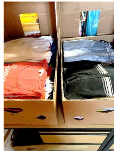
Vorbereitung von Kartons, Schulranzen, OP-Kitteln und anderen Hilfsgütern im Lager in Frauenaarach

Jeder aus dem Kaleb-Team kommt mehrmals in der Woche mit einem vollen Auto im Lager an – die Hilfsgüter stammen in der Regel aus der näheren Umgebung von Erlangen. Besonders wertvolle Sachen wie Schlafsäcke und Isomatten kommen manchmal auch per Post zu uns. Fast jeder von uns hat in seinem Zuhause