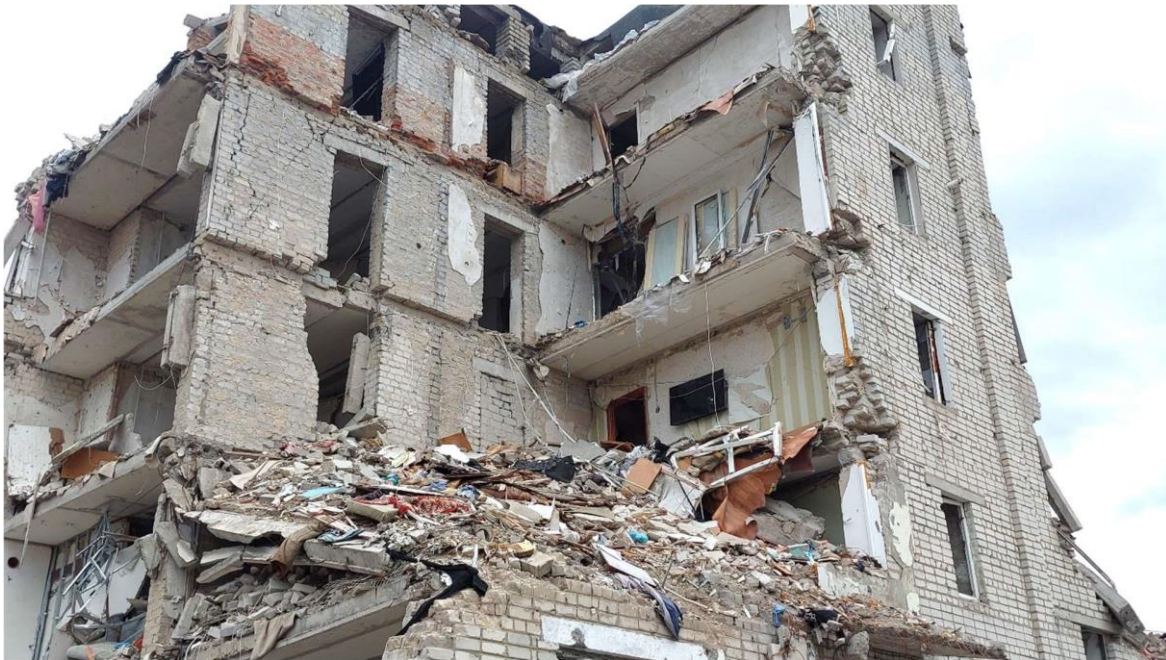
Auf dem Foto sieht man in der rechten Wohnung noch den Fernseher an der Wand hängen