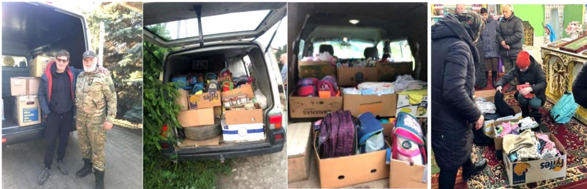
Vater Taras holte Ende Februar 2024 in einem unserer Zwischenlager in der Ukraine Hilfsgüter zur gezielten Weiterverteilung, unter anderem in seiner Gemeinde, ab /auf dem linken Foto zusammen mit Vitalij/

In unserem Info-Brief vom Januar 2024 hatten wir kurz berichtet, dass in einer ukrainischen Kleinstadt eine Weihnachtsfeier für Kinder in einem festlich geschmückten Luftschutzbunker stattfinden konnte. In Zusammenarbeit mit städtischen Behörden wurden Kinder eingeladen, die im Krieg einen Elternteil oder beide Eltern verloren haben. Jetzt haben uns auch Fotos davon erreicht, die wir mit Ihnen teilen: