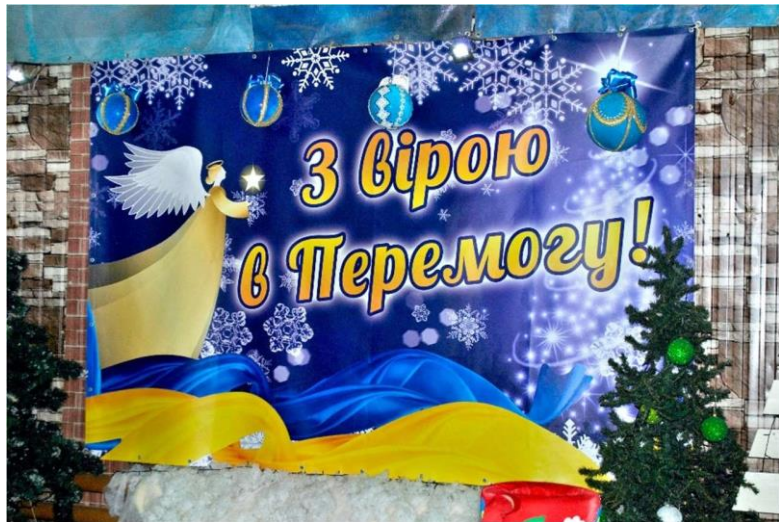
Glaube an den Sieg