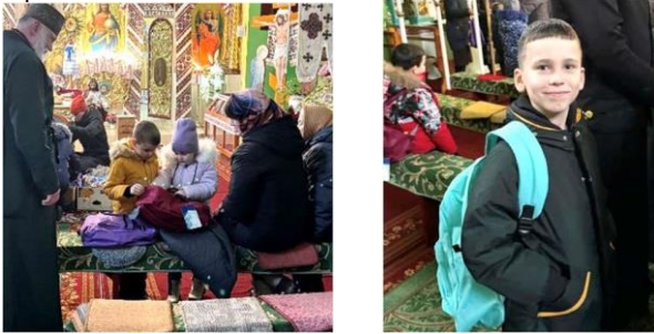
Weihnachtsgeschenke für Kinder in der Westukraine

https://www.kaleb-dienste-e-v-deutschland.org/