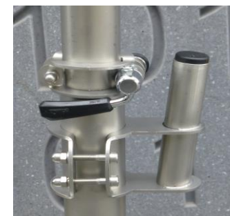
Vorrichtung zur Aufnahme eines Sattel-Stützen-Gepäckträgers