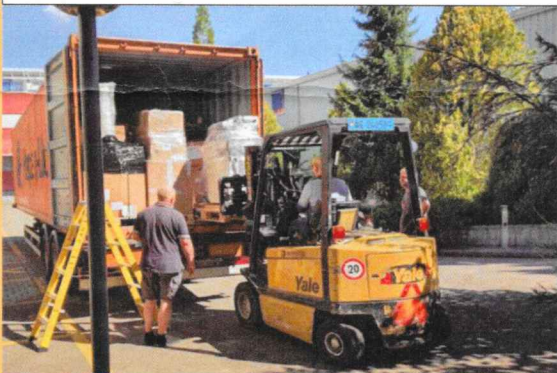
Envoi: par "Népalimed Schweiz" de Zürich