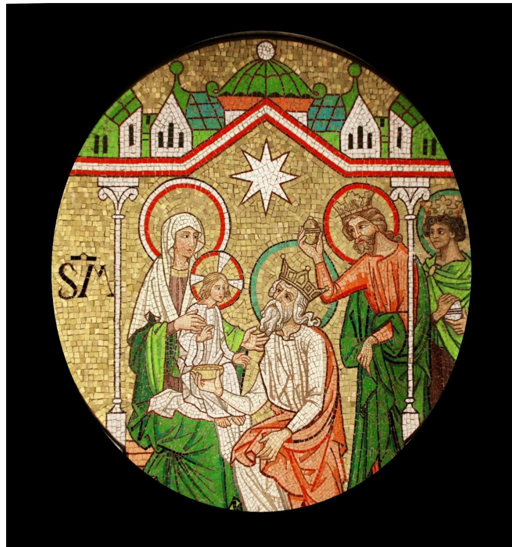
Detail aus dem Hochaltar in St. Peter und Paul (Dr. Niederée)