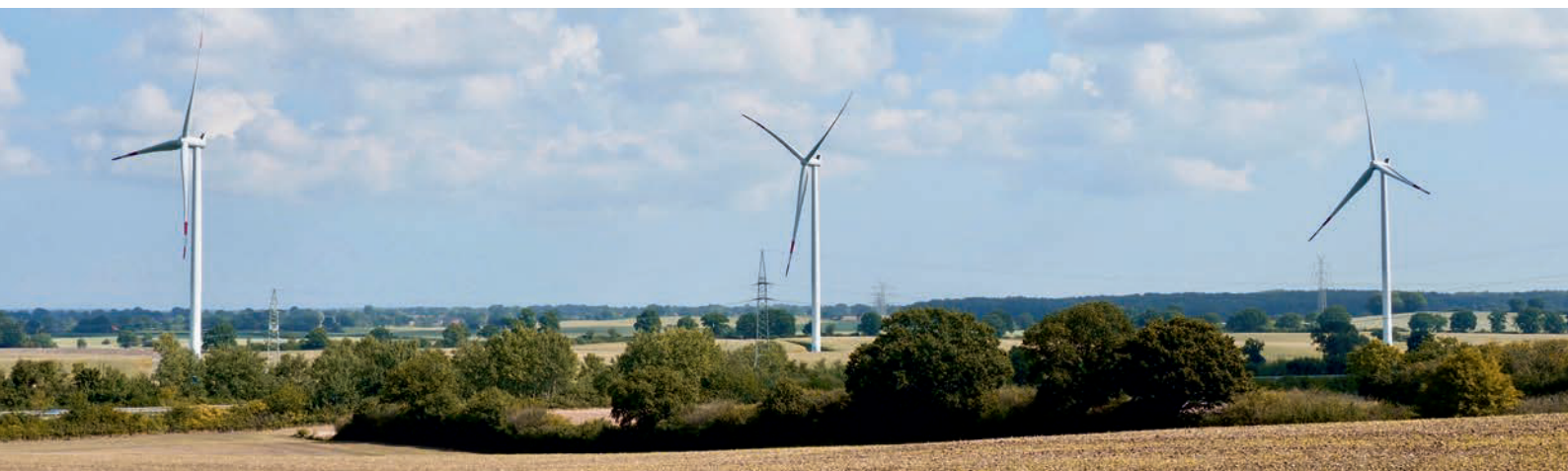
Heutiger Windpark Quarnbek aus Blickrichtung Hohenschulen/Achterwehr

Mönckbergseck 25a, 24107 Quarnbek / OT Strohbrück