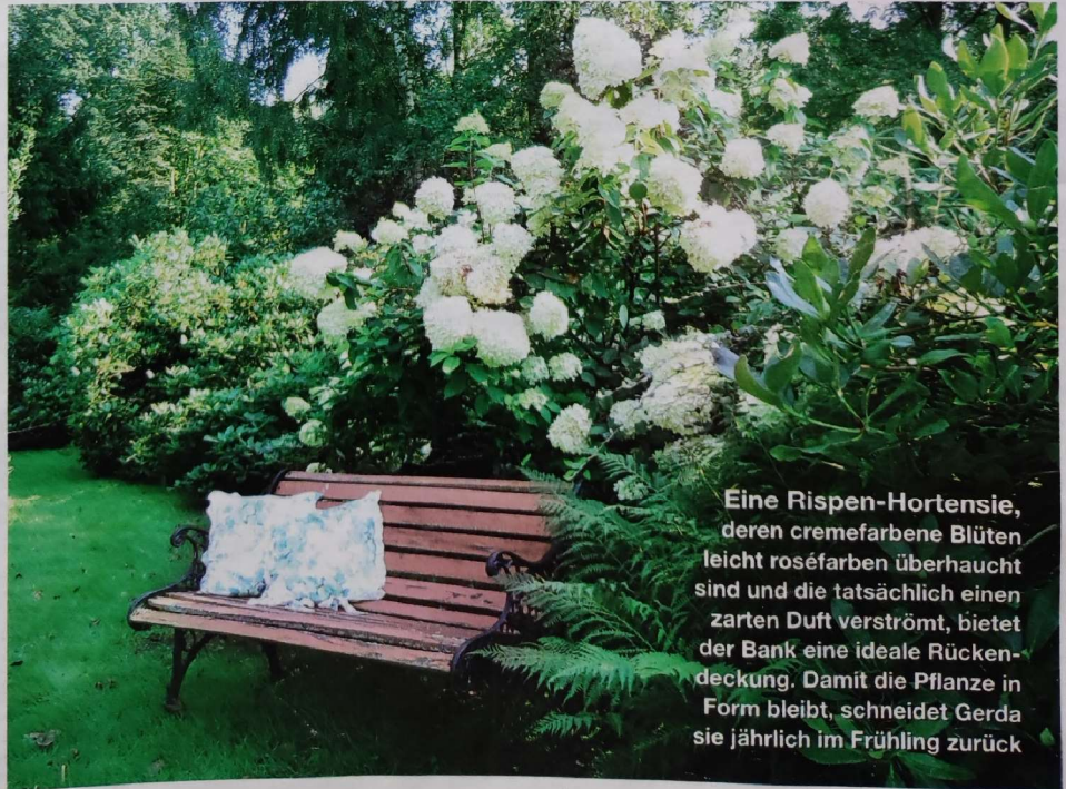
Eine Rispenthortensie, deren cremefarbene Blüten leicht roséfarben überhaucht sind und die tatsächlich einen zarten Duft verströmt, bietet der Bank eine ideale Rücken- deckung. Damit die Pflanze in Form bleibt, schneidet Gerda sie jährlich im Frühling zurück