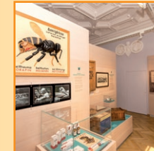
BAYERISCHES BIENEN- MUSEUM ILLERTISSEN SAMMLUNG FORSTER

und kostenlosem Aktions- und Führungsprogramm