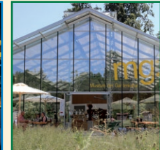
MUSEUM DER GARTENKULTUR ILLERTISSEN