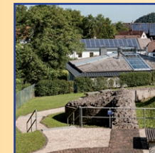
ARCHÄOLOGISCHER PARK KELLMÜNZ