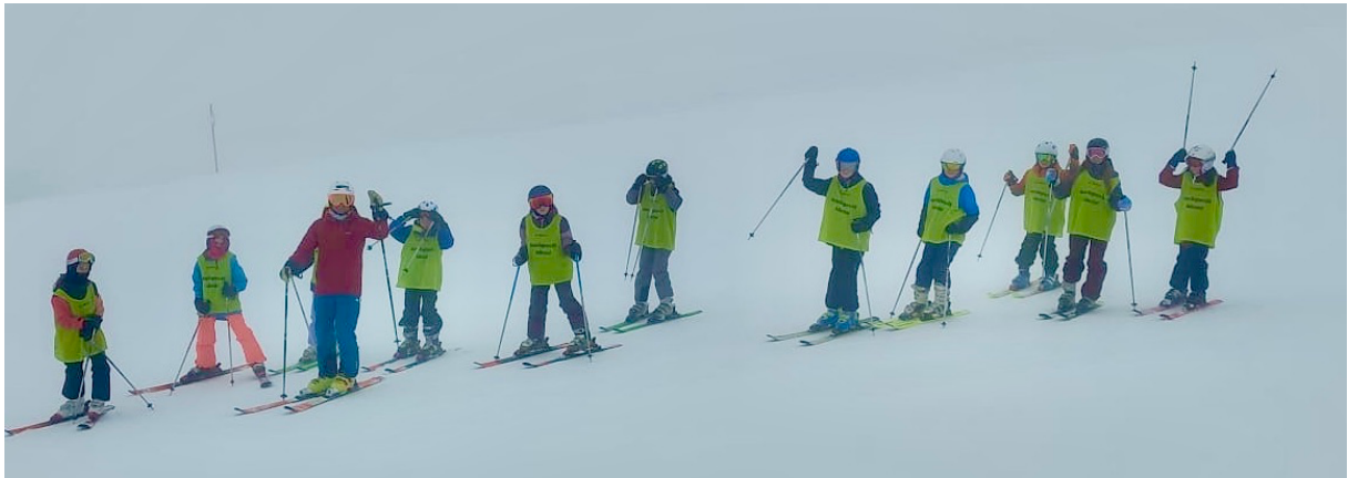
©Ski Team Grüße nach Berlin