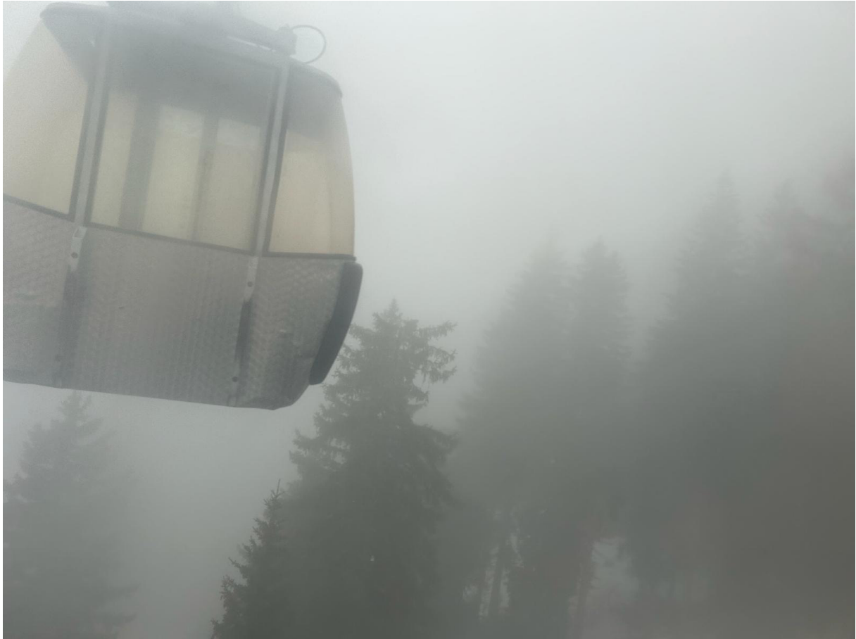
Solches Wetter hatten wir, aber auch solches...