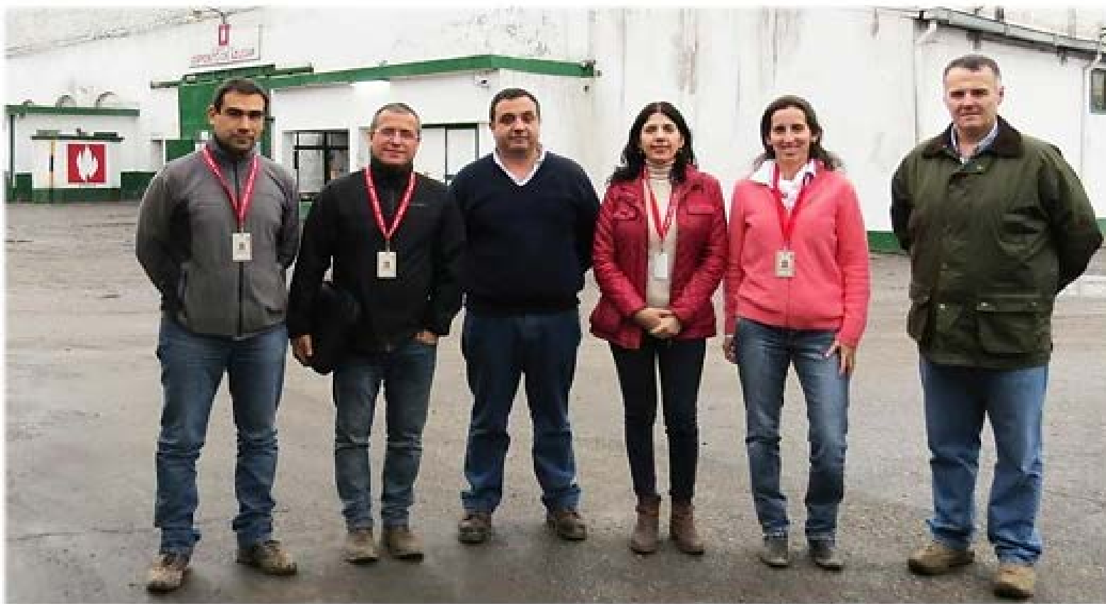
IMPLEMENTADORES-CERTIFICADORA – DIR. DE MEDIO AMBIENTE Y LA EMPRESA