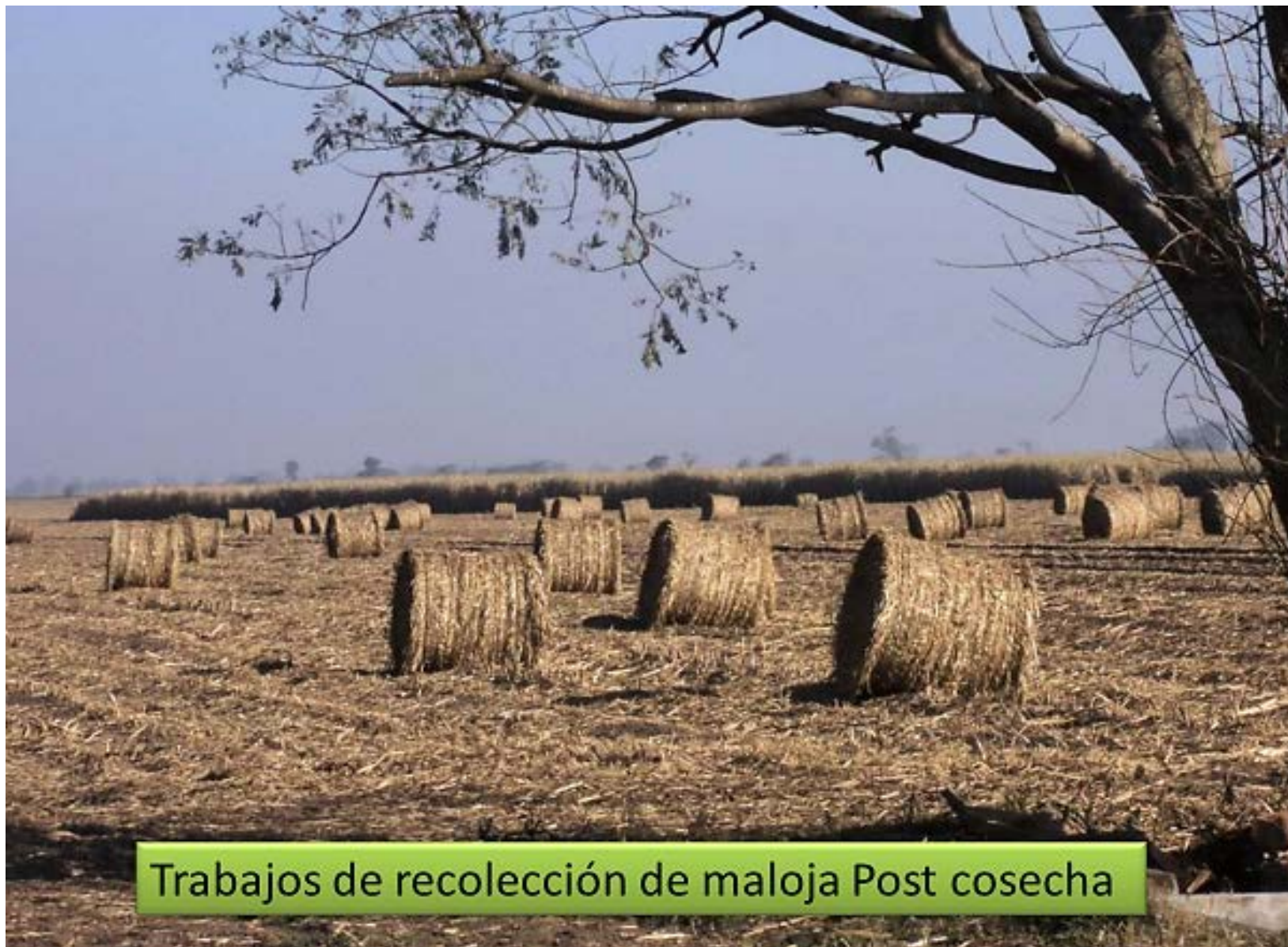
Trabajos de recolección de maloja Post cosecha