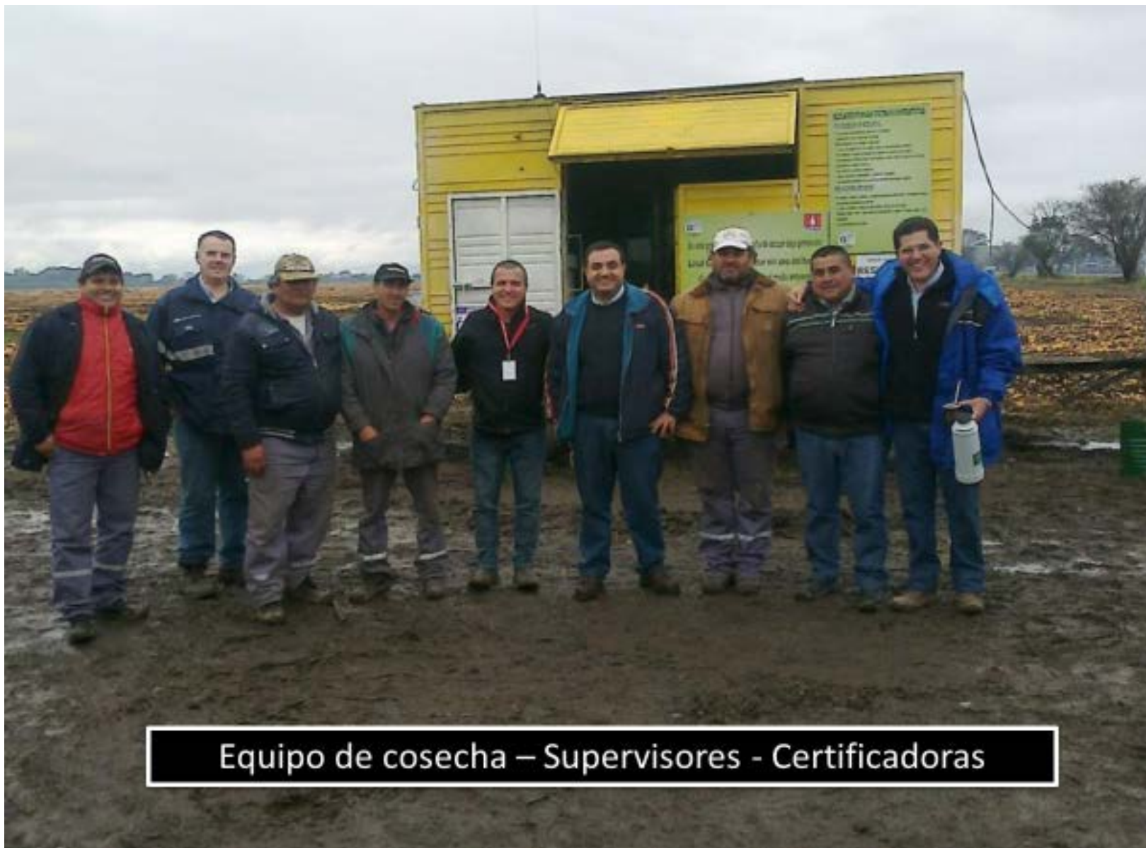
Equipo de cosecha – Supervisores - Certificadoras