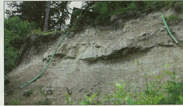
Dramatisch ist die Situation bei der Hütte des SAC Bristen.