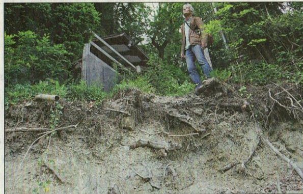
Der Weg bei der Teehütte des SAC Steile Wand ist abgerutscht. Zum Glück nur jener zum Materialdepot. Der normale Zustieg ist offen.