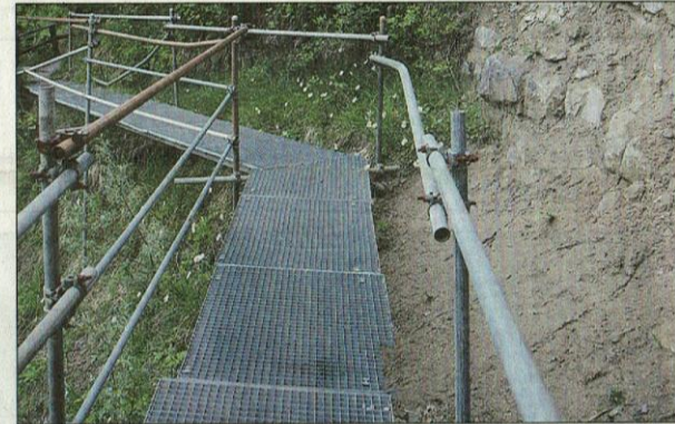
Der Zugang zur Hütte des Alpen-Clubs Felsenkeller ist durch einen luftigen Steg gewährleistet.