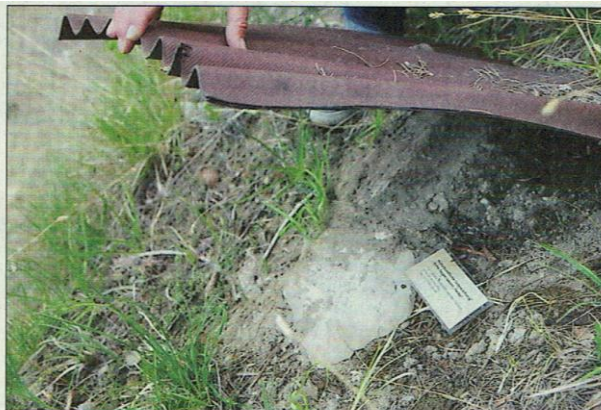
Im steilsten Teil der Fallätsche hat es diese Abdeckungen. Schlangen verstecken sich gerne darunter.