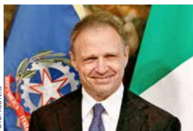
Francesco Lollobrigida, minister van Landbouw van Italië, denkt dat de meeste Italianen geen producten met insectenmeel zullen kopen.

Producten die insectenmeel bevatten, moeten in een apart schap in de supermarkten worden gelegd. "Zo kunnen mensen die ervoor kiezen om krekels, larven en sprinkhanen te kopen naar dit schap gaan en zij die dat niet doen, kunnen er wegblijven, zoals ik denk dat de meerderheid van het Italiaanse volk zal doen", zei minister van Landbouw Francesco Lollobrigida