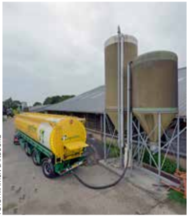
Levering van voer door Agrifirm.

De prijzen in de varkenssector stonden onder druk en mede door stijgende kosten was het in deze sector een uitdagend jaar. Toch waren de technische resultaten goed en wist Agrifirm naar eigen zeggen ook in deze sector marktaandeel te winnen.