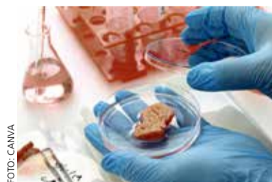
Productie van kweekvlees in een laboratorium. Onder het mom van het beschermen van de bevolking en de voedingscultuur, wil Italië kweekvlees gaan verbieden.

Het wetsvoorstel komt van minister Francesco Lollobrigida, die lid is van dezelfde rechtse partij als premier Giorgia Meloni. "Laboratoriumproducten garanderen naar onze mening geen kwaliteit, welzijn en de bescherming van onze cultuur, onze traditie", aldus Lollobrigida. De nationalistische regering van Meloni