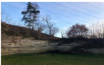
Posten 3: Sandgrüebli