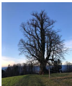
Posten 2: Linde