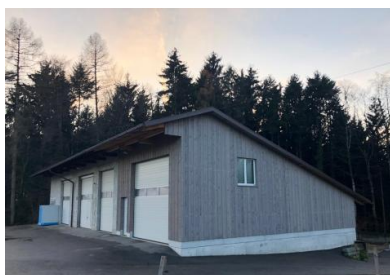
Posten 4: Schmittäegge