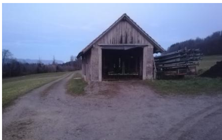
Posten 1: Schützehuus