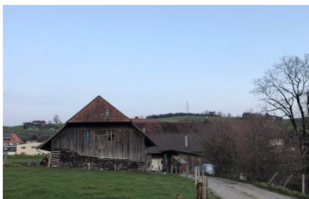
Posten 5: Mühlhof