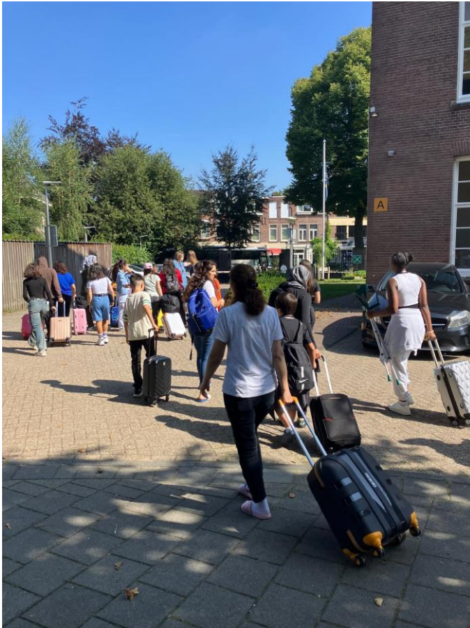
Vertrek van het azc naar de bus.

In alle vroegte waren de vrijwilligers op het azc aanwezig om goed voorbereid te kunnen vertrekken. Sommige kinderen stonden toen al klaar. Bepakt en bezakt en erg opgewonden. Uitgezwaaid door ouders, andere familieleden, azc medewerkers en vrijwilligers vertrokken we om 11.30 uur.