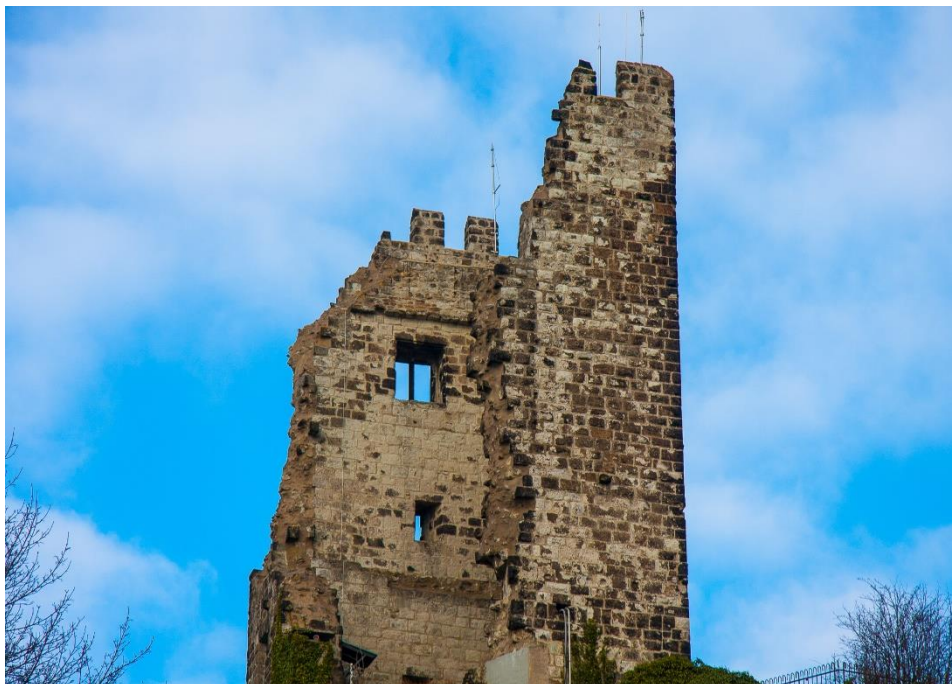
Auf dem Gipfel steht die Burgruine Drachenfels. Ort: Drachenfels, Königswinter.

Im Mittelgebirge – oder genauer gesagt – im Siebengebirge, liegt der Drachenfels. Nach oben gelangt man entweder mit der Drachenfelsbahn oder zu Fuß. Entscheidet man sich für die Wanderung, so entdeckt man auf dem Weg einige Sehenswürdigkeiten, zum Beispiel die Nibelungenhalle und das Schloss Drachenburg. Oben angekommen, bieten sich Weitblicke über das Rheinland und ein Restaurant, das zum Einkehren einlädt. Eine weitere Besonderheit am Gipfel ist die Ruine der ehemaligen Burg Drachenfels, erbaut im 12. Jahrhundert.