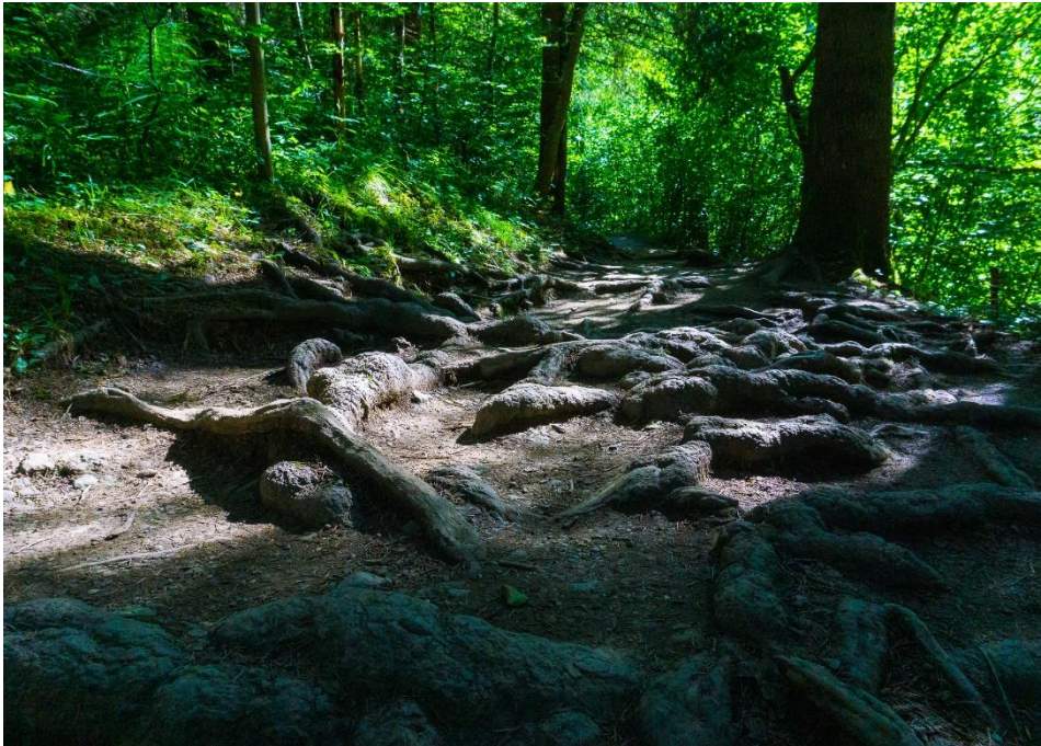
Abenteuerliche Wanderwege in Deutschland. Ort: Starzlachklamm, Bayern.

Eine Wanderung durch das Gebirge im Süden Deutschlands kann wahre Wunder wirken. Das kristallklare Wasser fließt durch die Felsen, die klare Luft lässt dich wieder aufatmen, auf der Alm angekommen, genießt du bei strahlendem Sonnenschein den Ausblick auf die schneebedeckten Berge. Oder du fährst in den Norden Deutschlands und lernst die Hansestadt Hamburg bei einer Bootstour kennen, isst dich durch die nordische Kulinarik und erlebst das bunte Nachtleben auf der Reeperbahn hautnah. Dafür musst du weder um die Welt jetten, noch viel Geld ausgeben. Deutschland bietet dir vielfältige Landschaften und neue Kulturen.