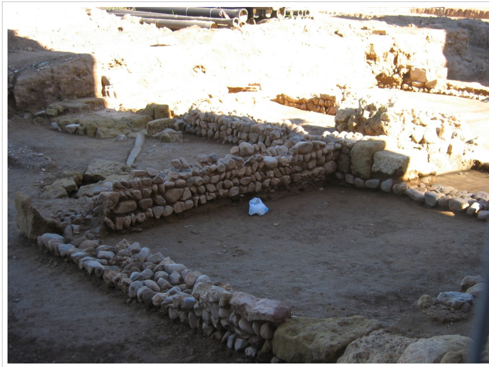
Vivienda construida con cantos rodados en un solar de la Avenida de Libia frente a la Avenida de Jesús Rescatado. Obsérvese que hasta los muros están hechos con guijarros (Sabular: arena gruesa y ¡tan gruesa!).