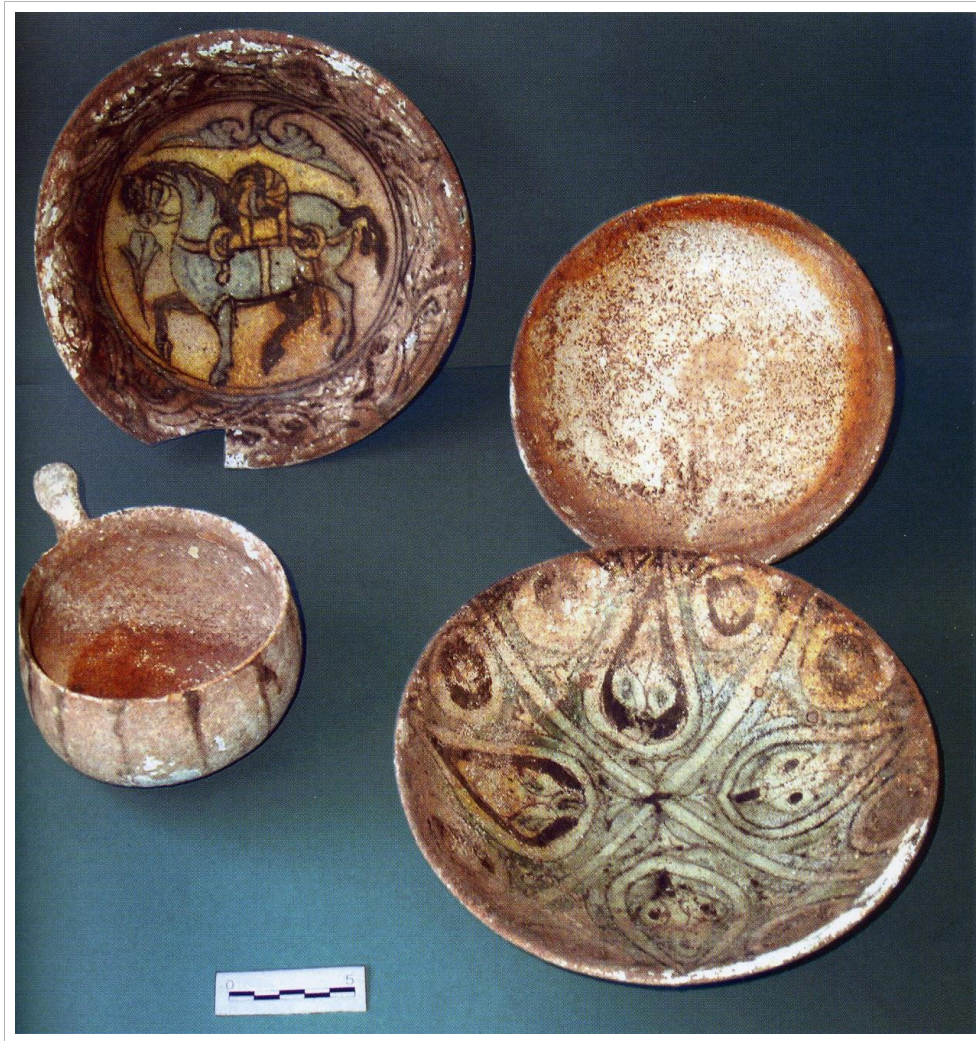
Vajilla procedente de al-Madina az-Zahira, hallada en un solar en la Avenida de Rabanales, esquina con la calle Juan Fernández (polígono de Levante), (arrabal del Shabular), en una casa que probablemente perteneció al arrabal de al-Madinat al-Zahira.