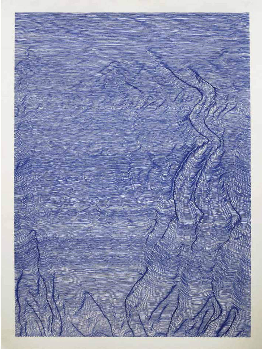
ohne Titel (Blaue Lineatur) 70x50cm Faserstift auf Papier 2021