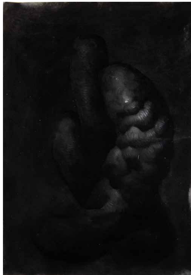
chromosomal 59x42cm Kugelschreiber auf Papier 2020