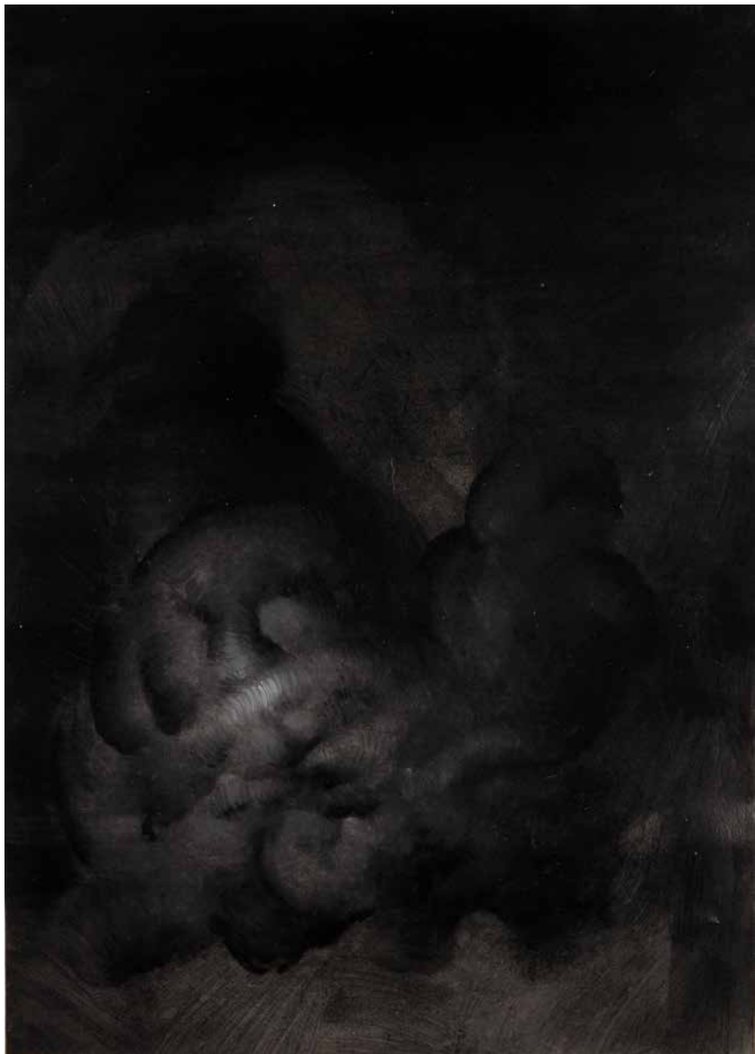
ektogenital 70x50cm Mischtechnik auf Papier 2020