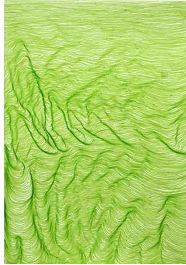
ohne Titel (Grüne Lineatur) 30x21cm Faserstift auf Papier 2021