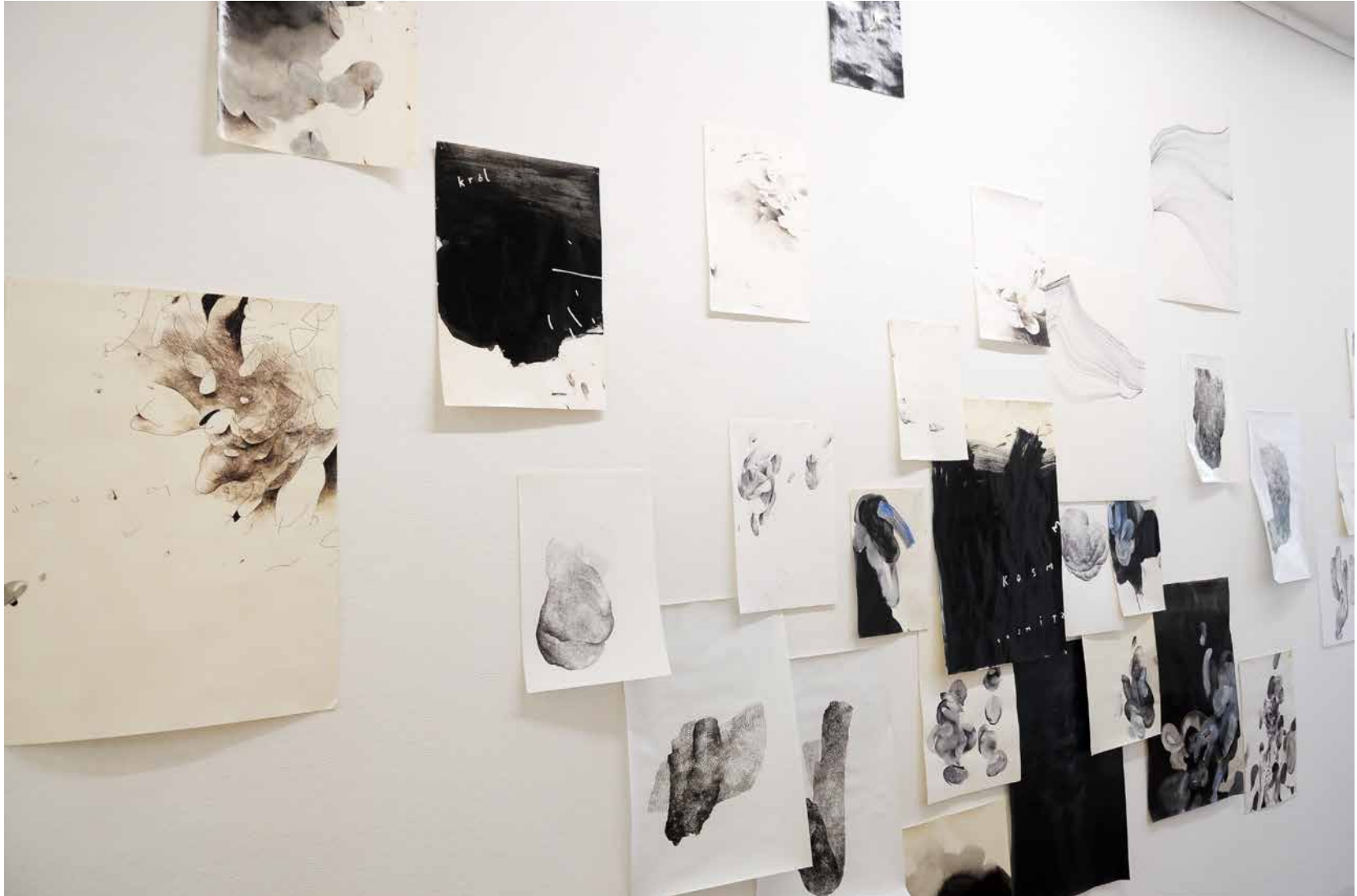
Installationsansicht Kunstverein Gelsenkirchen 2020