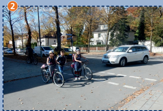
Einmündende Seitenstraßen, hier: Seyboth-/Bozzaristraße