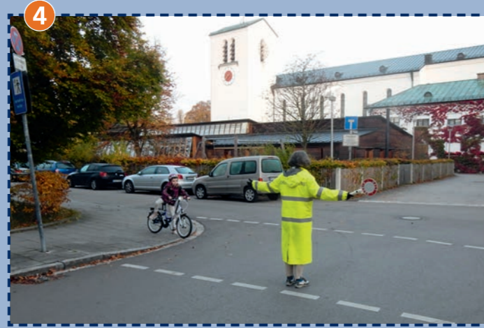
Am Hollerbusch (West), gesichert durch Schulweghelfer-innen und Schulweghelfer