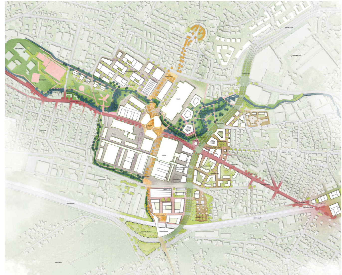
Lageplan für den neuen Stadtraum Bantlinstraße