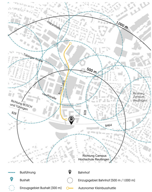
Zukünftige Vernetzung Radverkehr / Erschließung des Gebiets mit dem ÖPNV