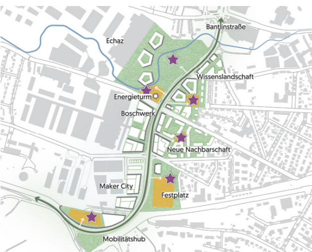
Neue Nachbarschaft: Umwandlung der Bantlinstraße zur angebauten Stadtstraße