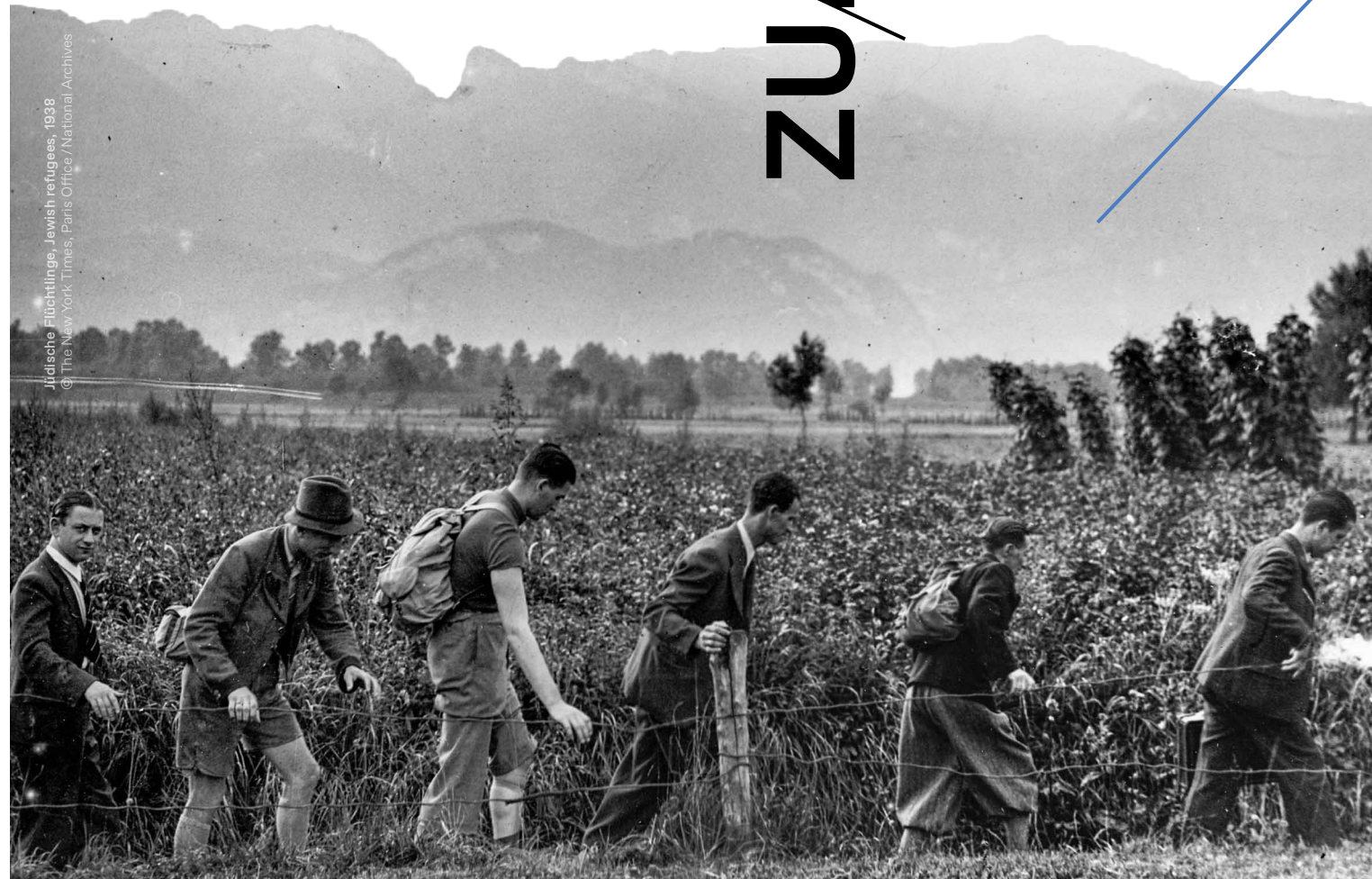
Jüdische Flüchtlinge, Jewish refugees, 1938