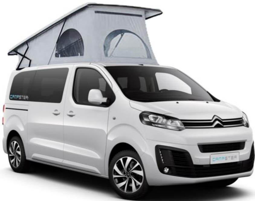
Abbildung Citroen Chassis

Irrtum, Preisänderung und Änderungen der technischen Angaben und Optionen sowie Änderung des Fertigstellungstermins vorbehalten