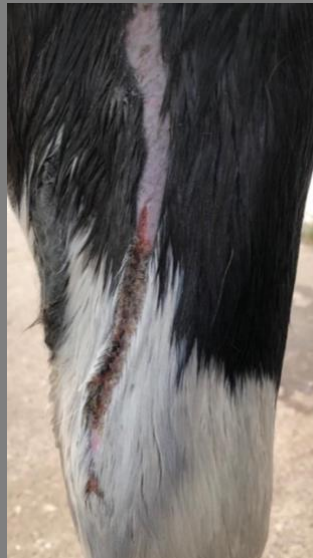
nach 7 Tagen